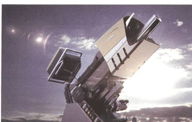
RUAG COBRA Mörsersystem

Das RUAG COBRA 120 mm Mörsersystem ist ein Hightech-Produkt, das neue Masstäbe für indirekte Feuersysteme setzt. Ein elektrischer Antrieb und eine halbautomatische Ladevorrichtung sorgen für entscheidende Präzision und Schnelligkeit. RUAG COBRA kann einfach auf jedem Rad- oder Kettenfahrzeug montiert werden und ist so ausgelegt, dass die Nutzer das System schon nach kurzer Schulungsdauer versiert einsetzen können.