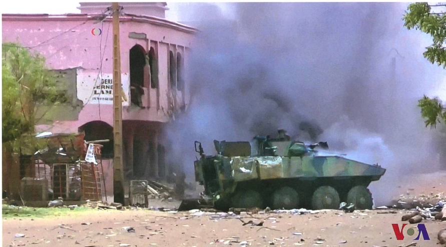
Nach einem islamistischen Anschlag in Gao.

Gegenläufig zum Strategiewechsel des Präsidenten Malis wollen elf Europäische Staaten – Belgien, Dänemark, Deutschland (wohl nur mit Logistik), Estland, Frankreich, die Niederlande, Norwegen, Portugal, Tschechien, Schweden und das Vereinigte Königreich – bis zum Sommer 2020 einen militärischen Anti-Terror-Verband für Mali aufgestellt haben. Dieser Anti-Terror-Verband mit dem Namen Takuba (das Wort bedeutet in der Tuareg-sprache Schwert) soll unter französischem Kommando – die französischen Streitkräfte sind ehemalige Kolonialmacht und seit Jahrzehnten in Afrika aktiv – sowohl Malis Truppen als auch die französische Mission Barkhane im offensiven Kampf gegen Dschihadisten unterstützen. Takuba sollen mehrere Hundert Einsatzkräfte angehören und seine Arbeit in der Region Liptako aufnehmen. Das Grenzgebiet zwischen Mali und Niger gilt als Rückzugsort für einflussreiche Dschihadisten-gruppen. 8 Die 4500 Soldaten starke französische Operation Barkhane mit 19 Hubschraubern, zehn Transportflugzeugen, sieben Kampfflugzeugen, drei Drohnen und ca. 1000 militärischen Fahrzeugen war in den letzten Monaten immer stärker an die Belastungsgrenze geraten. 9 Als erster EU-Staat kündigte Estland Ende 2019 an, in der zweiten Jahreshälfte militärische Spezialkräfte für Takuba zu entsenden. Die französische Anfrage ging auch an