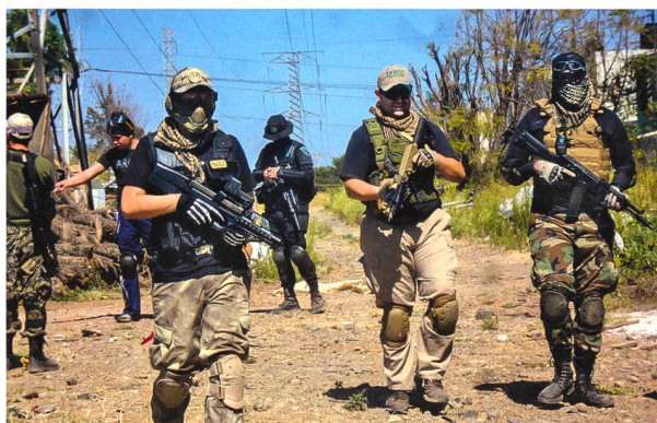
Aufgrund zunehmender Privatisierung und Outsourcing von Sicherheitsdienstleistungen boomen Militär- und/oder Sicherheitsdienstleistungsunternehmen (PMSCs) weltweit.

Der eigentliche Nährboden dieser Entwicklung führt auf den Rückgang der Verteidigungsbudgets, die zunehmende Re-