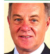
Général de Corps d'Armée Jean-Paul Raffenne Lehrbeauftragter Uni Toulouse 31000 Toulouse (France)

* Edition Odile Jacob – Paris Septembre 2017.