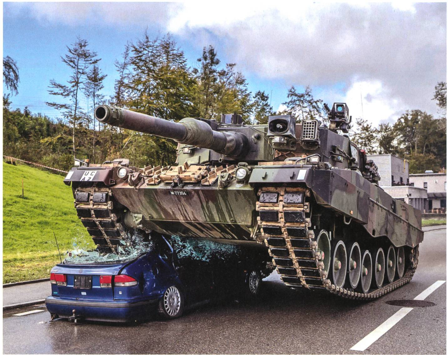
Nur eine Übung – Demo 19 des LVb G/Rttg/ABC.

Die regelmässigen Kontakte des Schadenzentrums VBS mit der Militärpolizei sowie der Militärischen Schaden und Unfallprävention (MUSP) wurden im Berichtsjahr in zweifacher Hinsicht erweitert: Alle zwei Monate findet neu ein sogenannter Geschäftsabgleich mit dem Chef Fahrzeug-, Genie- und Rettungsmaterial der LBA sowie dem Kommando