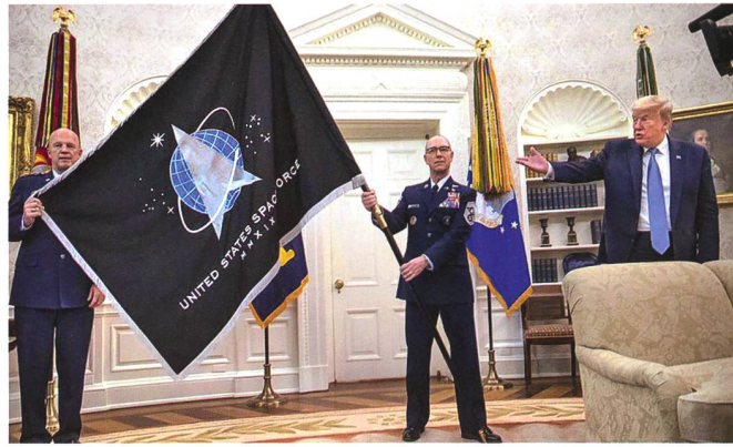
Logo und Fahne der US-Space Force.

Der Präsident sagte: «Das Weltall wird sowohl hinsichtlich Verteidigung und Angriff als auch so vielen anderen Din-