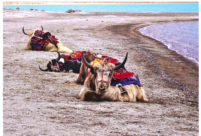
Trägerische Ruhe am Pangong Tso See in Ladakh.

In der Vergangenheit wurden die meisten Streitigkeiten zwischen China und Indien durch Treffen zwischen örtlichen Militärkommandanten schnell beigelegt, was einige diplomatische Interventionen erforderte.