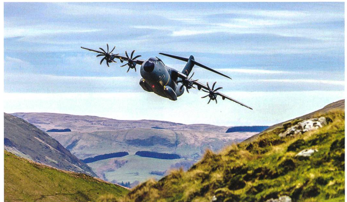
A400M im Tiefflug über den Pyrenäen.