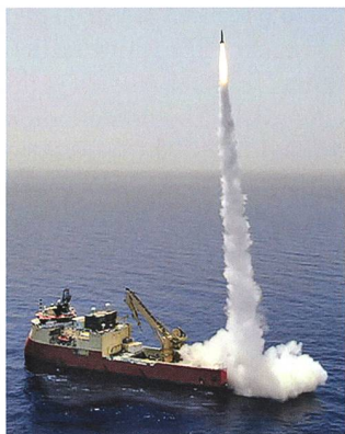
Schiessversuch mit LORA erfolgreich abgeschlossen.

Anfangs Juni war es so weit: Die Israel Aerospace Industries (IAI) konnte sein Long Range Artillery Weapon (LORA) System erfolgreich testen. Besondere Herausforderung war, dass infolge der COVID-19 Restriktionen die Raketen ausschliesslich ferngesteuert ab-