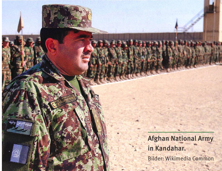
Afghan National Army in Kandahar.