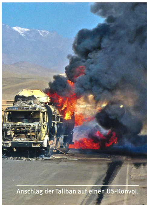
Anschlag der Taliban auf einen US-Konvoi.

Im Mai 2020 wurde ein dschihadistischer Anschlag auf die Entbindungsstation eines Krankenhauses in Kabul verübt, dabei mindestens 14 Menschen getötet, unter ihnen zwei Neugeborene, mindestens 15 weitere Zivilisten wurden verletzt. In dem vom Anschlag betroffenen Krankenhaus sind auch ausländische Mitarbeiter von «Ärzte ohne Grenzen» (MSF) tätig. Einem Augenzeugen zufolge trugen die dschihadistischen Attentäter Polizeiuniformen. Erst nach stundenlangem Einsatz gelang es afghanischen Spezialkräften, die im Gebäude eingeschlossenen Menschen in Sicherheit zu bringen; alle