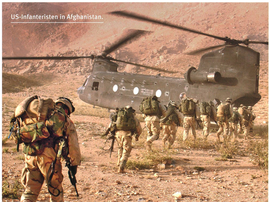
US-Infanteristen in Afghanistan.