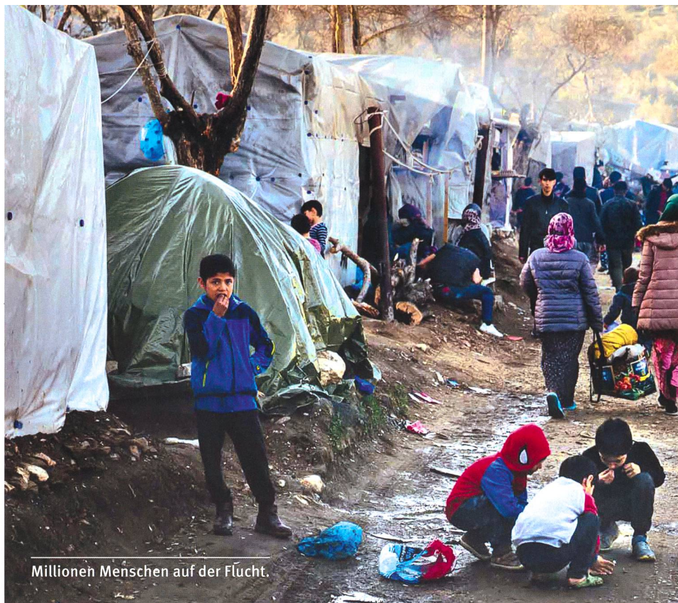
Millionen Menschen auf der Flucht.

Die Frage der Kontrolle der Grenzen (Schengenverträge) ist nicht die erste Auf-