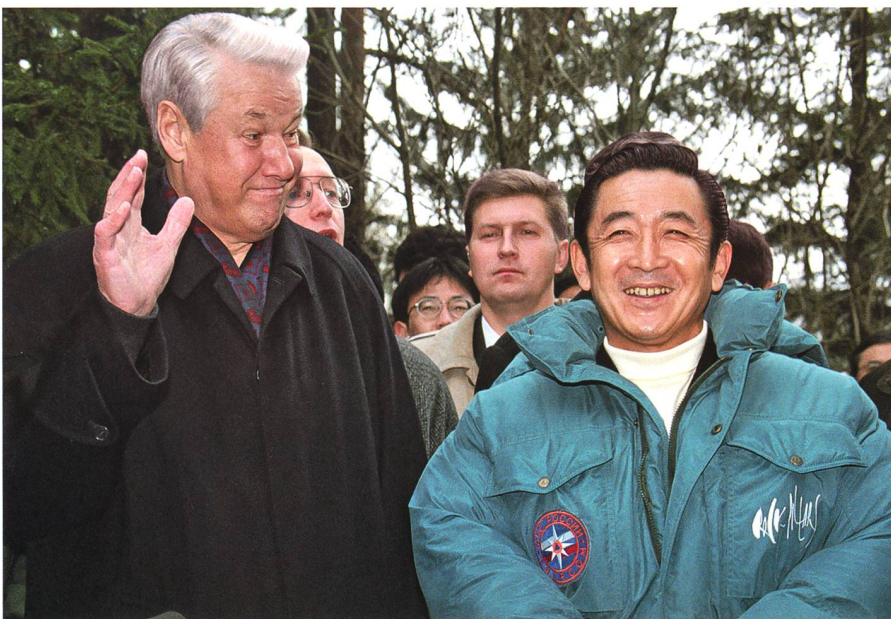
Der russische Präsident Boris Jelzin und der japanische Ministerpräsident Ryutaro Hashimoto, 1977.

Auf ihrer Konferenz in Kairo, Ende 1943, hatten die Alliierten festgelegt, das Kaiserreich müsse alle Gebiete aufgeben, die es mit «Gewalt und Habgier» erworben hätte; dabei wurde die Kurilen-Frage nicht genannt. Seit 1946 fordert Nip-