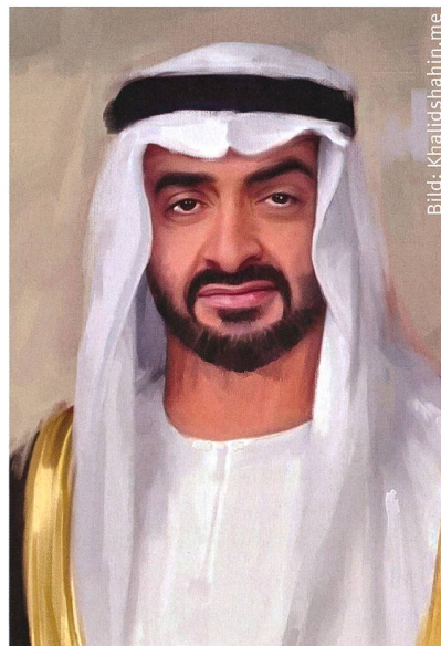
Mohammad Bin Zayid Al Nahayan.