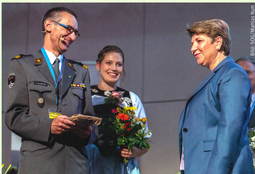
Chefin VBS und Präsident SOG.

direktor des Kantons Bern, die Grüsse der Kantonsregierung. Er schickte voraus, dass die Sicherheit von Land und Leuten nicht verhandelbar ist und zeigte auf, dass wir, mit Verteidigungsausgaben pro Jahr von etwa 0,7% des BIP, in Europa zuhinterst