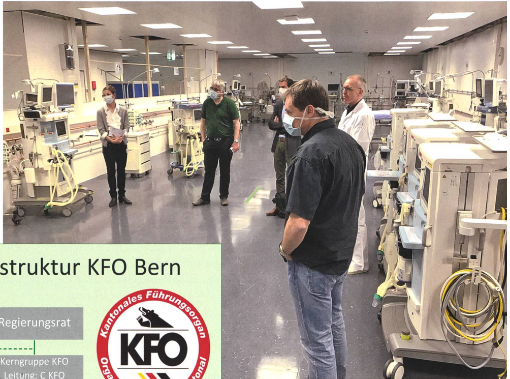
KFO Bern besucht den Krisenstab des Inselspitals Bern.

Grundsätzlich wurde dem KFO BE ein gutes Zeugnis ausgestellt. Die gestellten Ziele wurden erreicht. Die Fallzahlen konnten im Deutschschweizer Durchschnitt gehalten werden, das Gesundheitswesen hat jederzeit funktioniert und konnte mit ausreichend Schutzmaterial