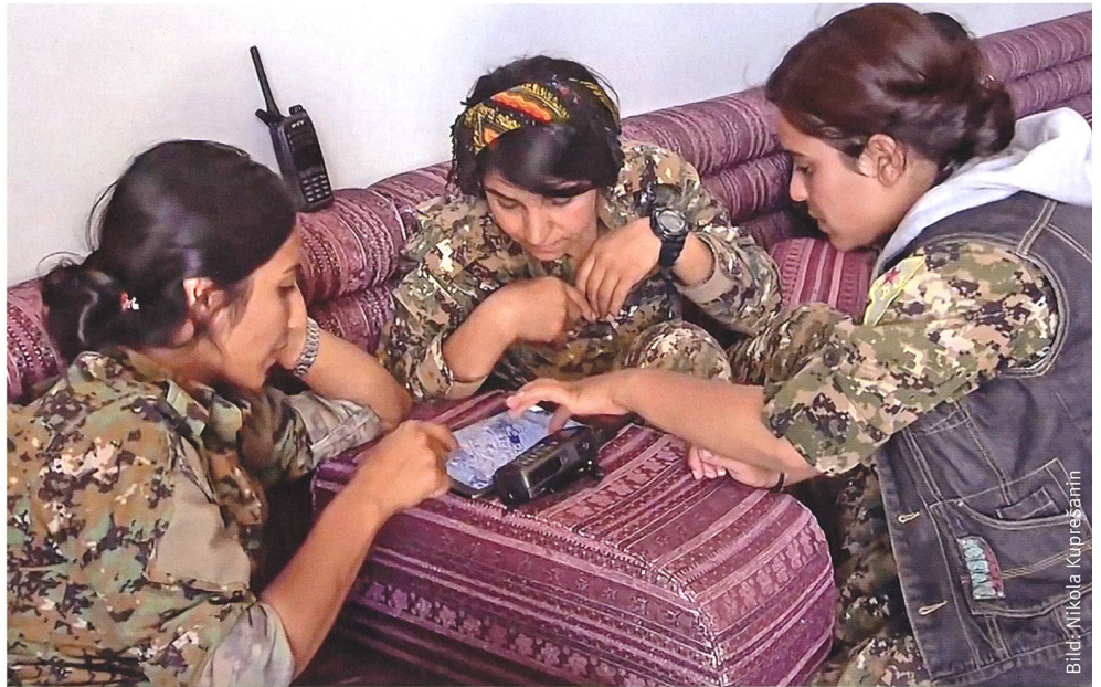
Die Schlacht um Rakka wurde als «Multi-Domain Operation» im Cyberspace, am Boden und aus der Luft geführt.

Diese insbesondere auch sprachliche Fähigkeit zur Zusammenarbeit hat die Schweiz nach dem politischen Widerstand gegen die Konzeption «Sicherheit durch Kooperation» systematisch abgebaut – aber nicht ganz.