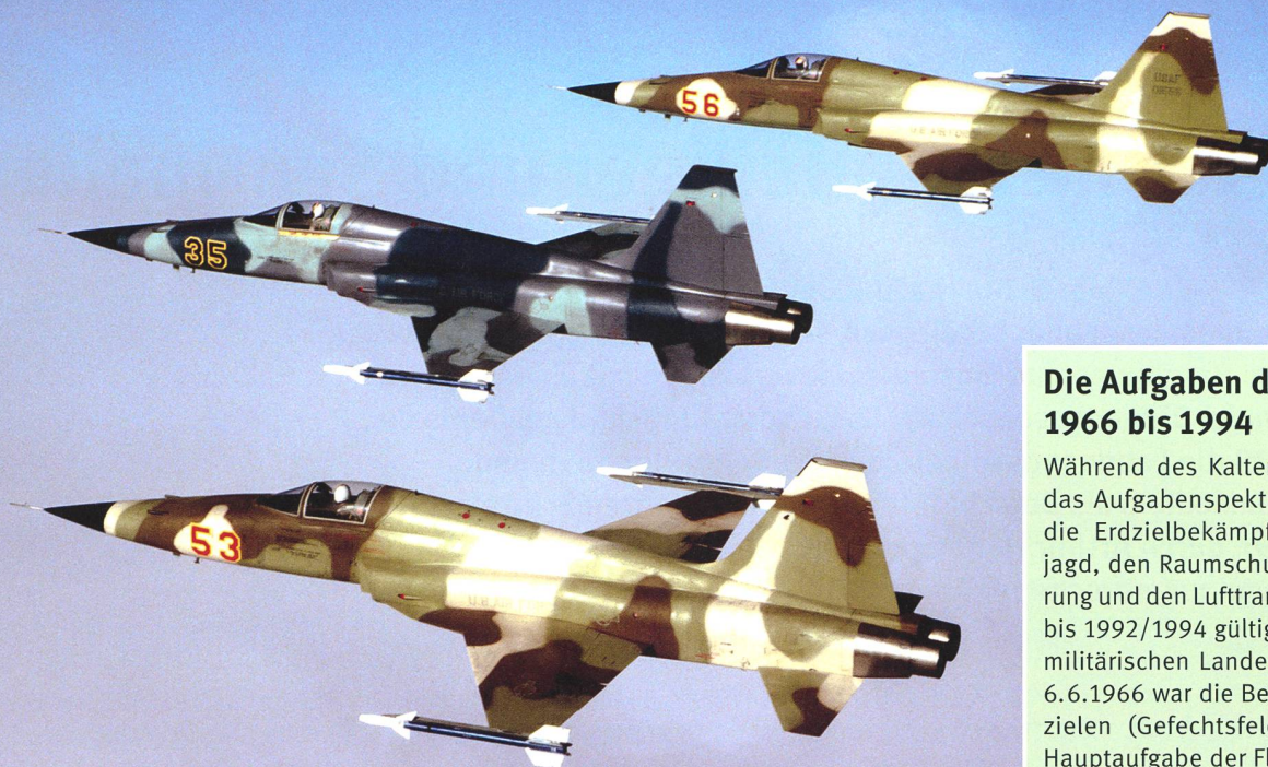
F-5E «Tiger II» der 527th TFTAS (1983).

erster Linie bei und von den Nachbarluftwaffen, der USAF, der britischen RAF, der israelischen IAF und der schwedischen Flygvapnet, gehörten seit 1965 regelmässig zum Programm der Flieger- und Fliegerabwehrtruppen. 5 Anders als die Luftwaffen der NATO-Staaten, wo die meist kriegsunerfahrenen europäischen Flugzeugbesatzungen zusammen mit ihren kampferprobten Bündnispartnern (vor allem USAF) übten, verfügte die neutrale schweizerische Flugwaffe aber nicht über