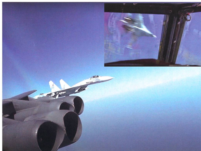
Zwei Su-27 fangen B-52 ab.

Unter dem Decknamen Allied Sky überflogen am 28. August insgesamt sechs B-52-Stratofortress-Bomber sämtliche Mitgliedstaaten der NATO an einem einzigen Tag. Zwei Bomber über den USA und Kanada, die restlichen vier starteten zu dieser einzigartigen Mission in Grossbritannien. Begleitet wurden die Langstreckenbomber von über 80 Kampfflugzeugen aus 20 verschiedenen Nationen. NATO-Generalsekretär Jens Stoltenberg präzisierte die strategische Wirkung dieser Übung: «Dieser Überflug zeigt das starke Engagement der Vereinig-