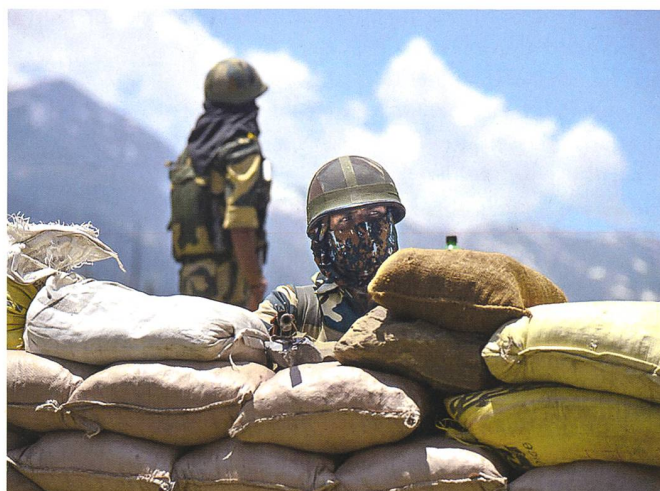
Soldaten der indischen Grenztruppen.

Indiens Verteidigungsministerium betonte, dass die indische Armee Frieden durch Dialog bewahren wolle, aber gleichzeitig seine territoriale Integrität beschützen werde. Chinas Militärsprecher hingegen warf Indien vor, mit seinen Aktionen den Konsens in den Gesprächen nach den Zwischenfällen im Juni untergraben zu haben. «Wir fordern die indische Seite auf, sofort ihre Truppen zurückzuziehen, die illegal die Grenze überschritten haben.» Indien müsse sich an seine Zusagen halten, um eine weitere Eskalation zu vermeiden.