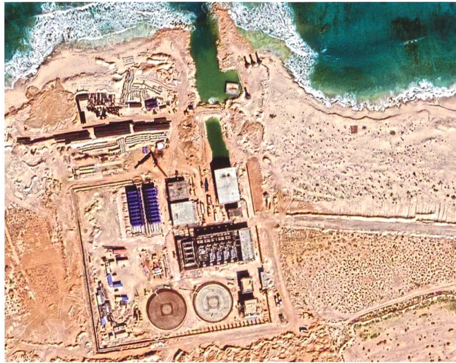
Atomanlage an der Küste.

Ab 2021 soll in der ägyptischen Küstenstadt El Dabaa bei El Alamein, etwa 130 Kilometer nordwestlich von Kairo gelegen, eine Atomkraftanlage entstehen. Ägypten ist damit das zweite Land auf dem afrikanischen Kontinent (nach Südafrika), das sich der Kernenergie bemächtigen wird. Infolge der COVID-19-Pandemie verzögerte sich das finale Projekt, das seit einem Jahr mit Unterstützungsbauten vorbereitet wird. Im August bestätigte die lokale Atomenergiebehörde nun, dass innert Jahresfrist endlich mit den definitiven Bautätigkeiten begonnen werden soll. Wohl aber nicht vor der zweiten Hälfte 2021. Das Kraftwerk soll der-einst 4800 Megawatt Strom liefern. Die Bauherrschaft übernimmt die staatliche russische Rosatom. Die beiden Länder unterzeichneten dazu bereits 2015 ein bilaterales Abkommen. Kostenpunkt des Werks, das aus 4 WWER-12 (Wasser-Wasser-Energie Reaktoren)