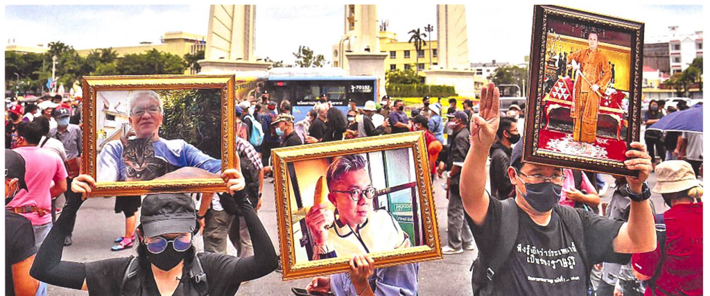
Demonstranten in Bangkok.

schen der Regierungen beugt. Im kommunistischen Vietnam zensiert der Konzern Beiträge, die die dortigen Aufseher als «anti-staatlich» betrachten. Im strengen Stadtstaat Singapur