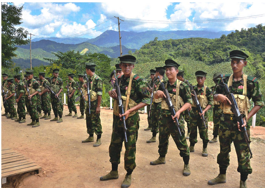
Kachin Independence Army.

Das Fazit lautet ganz einfach: Die Gemengelage bleibt. ■