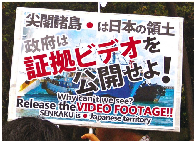
Zwischenfall bei den Senkaku-Inseln. Japaner verlangten die Veröffentlichung des Videos.

Der wichtige Wirtschaftsverband Nippon Keidanren ist bekanntlich pro China und übt stets einen starken Druck auf die Regierung aus. Der riesige Markt Chinas mag für ihn äusserst attraktiv sein. Es ist jedoch nicht weitherum bekannt, dass ausländische Unternehmen, vor allem japanische, die sich aus China zurückziehen wollen, ihr dortiges Vermögen verlieren und sogar zusätzliche Kosten zu tragen haben. Ex-Premierminister Abe war an die Pro-