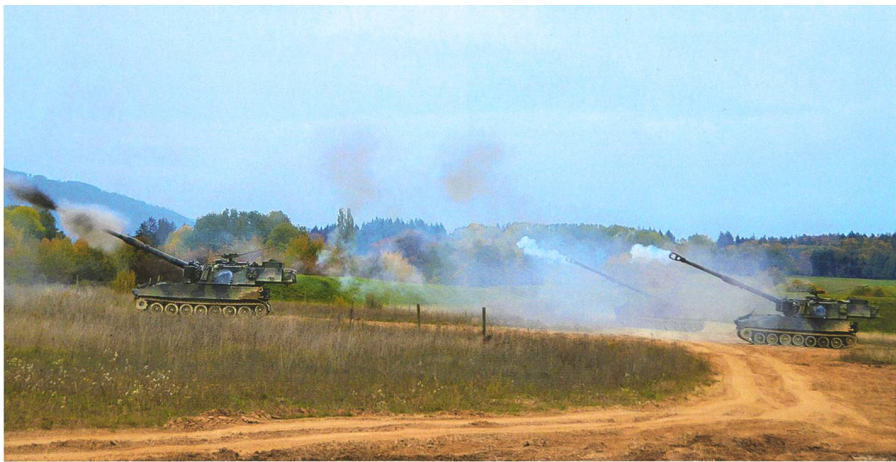
Art Btr 10/4 im Feuergefecht in der Champagne Bière.