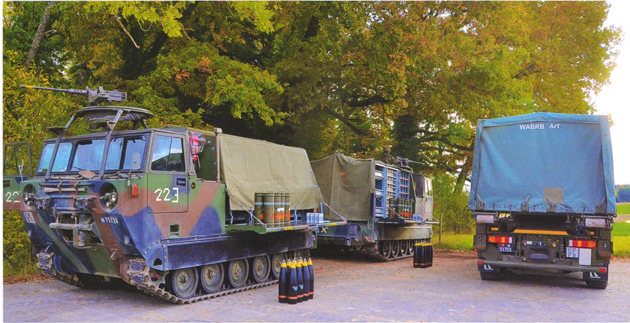
Mun Nachschub durch den Ns/Rs Z der Art Btr 10/2 im Crêt de Mai. Neben den zwei Mun «Schnecken» der Btrr IVECO Lastwagen mit dem Mun Modul.

mal 13 von 24 Geschützen. Auf den ersten Blick ortet man hier Einteilungs-Unterbestände an Kan Spezialisten. Beim genaueren Hinschauen ist die Situation aber etwas komplexer: Meistens sind auf dem Papier genügend AdA vorhanden. Viele haben jedoch ihre Ausbildungsdienstpflicht früher als erwartet erfüllt, bleiben jedoch noch im PISA-System eingeteilt. Ausserdem werden praktisch alle Dienstverschiebungsgesuche bewilligt, was letztlich dieses Bild in der Übung ergibt.