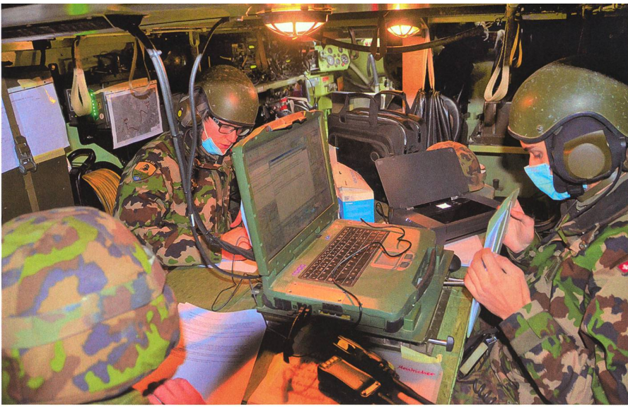
Blick in einen der beiden M-113 Spz des Abt Gefechtsstand Art Abt 10 – im Zentrum der INTAFF Feuerleitbildschirm.

versorgt, das heisst die «Mun-Schnecken» mit ihren Raupen kommen nur noch im morastigen Gelände für den Mun Nachschub zum Einsatz.