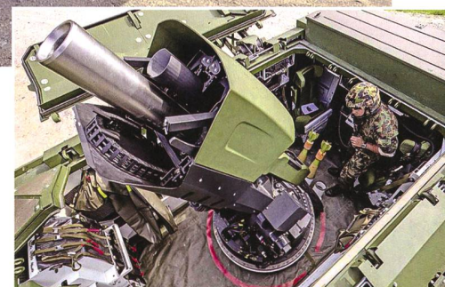
Panzermörser 16 mit geöffneten Geschützraum-Deckeln; Ansicht von oben.

Allein aufgrund dieser Feststellung ist das Schlussurteil in der Truppentauglichkeitserklärung, der Panzermörser 16 sei «bedingt truppentauglich», mehr als erstaunlich. Wie kann ein Waffensystem als bedingt truppentauglich beurteilt werden, wenn nicht geprüft worden ist, ob es