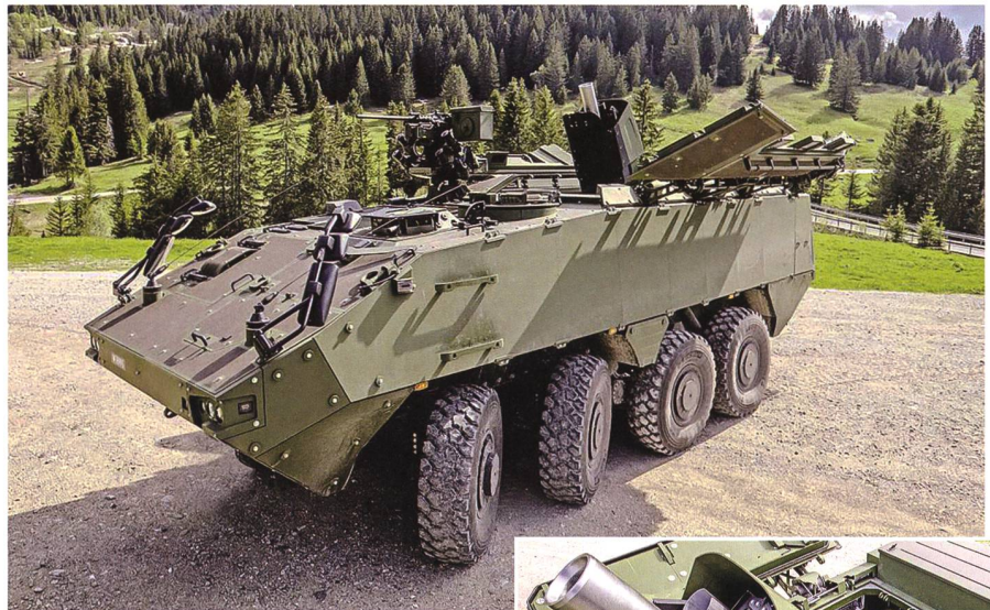
Panzermörser 16 mit geöffneten Geschützraum-Deckeln.

Am 24. April 2020 veröffentlichte die armasuisse ohne Kenntnis und Zustimmung der in die Überprüfung der Truppentauglichkeit des Panzers involvierten militärischen Stellen eine Medienmitteilung, der Panzermörser 16 sei truppentauglich. Dies entsprach nicht dem erst am 25. Mai 2020 unterzeichnet vorliegenden Bericht über die Ergebnisse des im März 2020 erfolgten Truppenversuchs. Darin wurde der Panzermörser 16 als nur «bedingt truppentauglich» qualifiziert. Diese Beurteilung überzeugt allerdings nicht aufgrund der festgehaltenen Ergebnisse der vorgenommenen Prüfungen und aufgrund der nicht durchgeführten Kontrollen. 5 Die verfrühte und falsche Medienmitteilung der armasuisse ermöglichte insbesondere folgende, aufgrund des EFK-Berichts naheliegende Argumentation beziehungsweise Schutzbehauptung: Zwar habe die EFK Unregelmässigkeiten bei der Beschaffung des Panzermörsers 16 gerügt; dennoch liegt nun ein brauchbares, truppentaugliches Waffensystem vor.