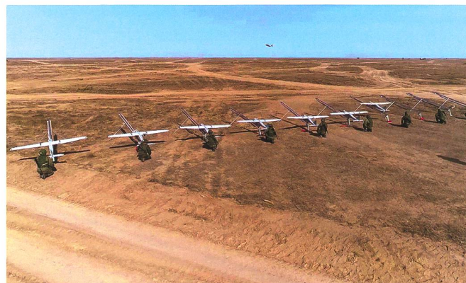
UAV-Batterie ist startklar.