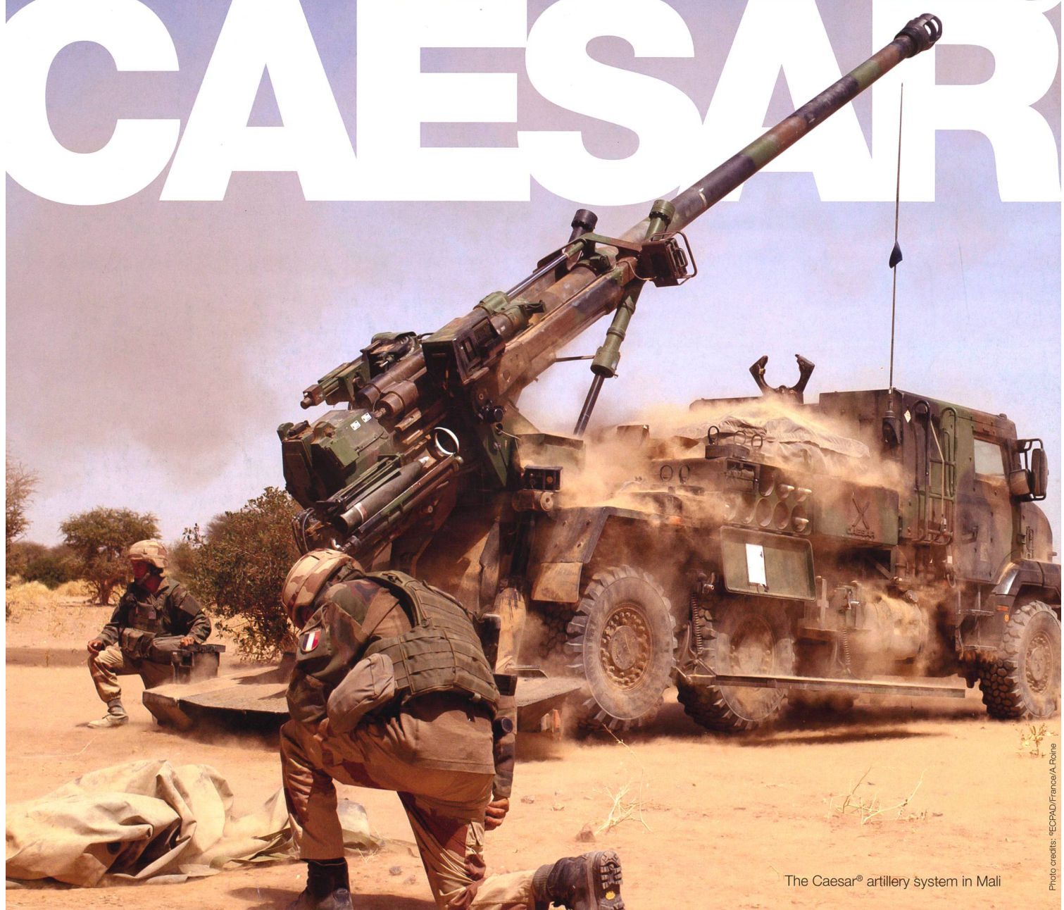
The Caesar® artillery system in Mali