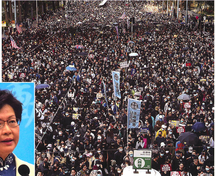
Massenproteste in Hongkong 2019.

Der erste konkrete Konflikt zwischen den Menschen in Hongkong und der chinesischen Regierung geht auf den Souveränitätswechsel im Jahr 1997 zurück. China hatte damals das lokale repräsentativ-demokratische System quasi