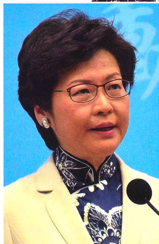
Carrie Lam, bisherige Chief Executive Sonderverwaltungszone Hongkong.

für ungültig erklärt. Peking musste dann zurücksrudern. 2003 wurde die Hongkong-Regierung dann von der chinesischen Staatsführung