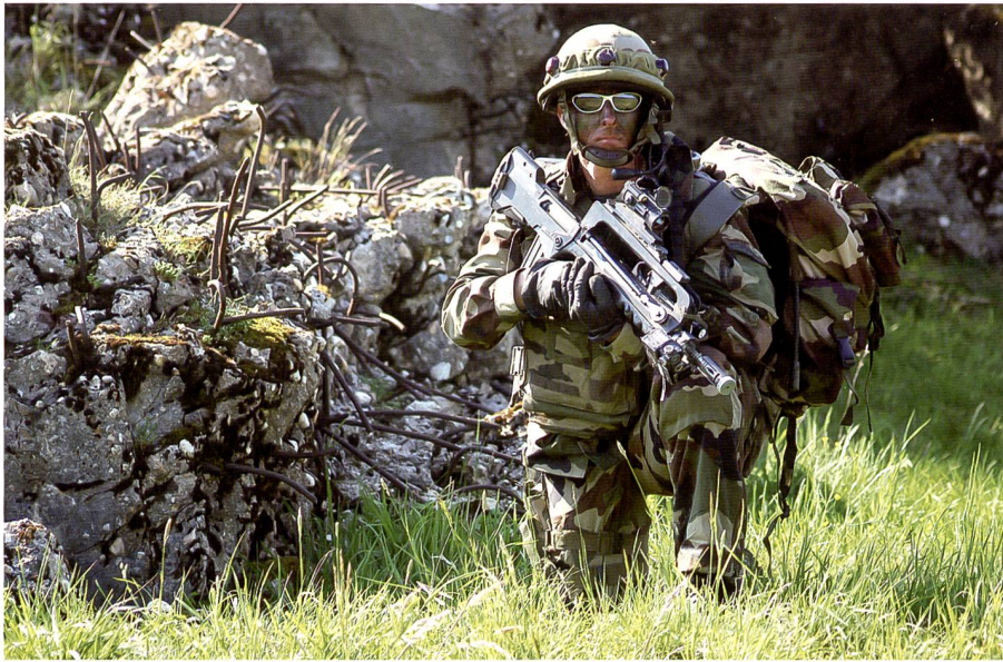
Französischer Infanterist: Die Idee einer europäischen Armee ist nicht neu, mittelfristig aber eher unrealistisch.

in der EU-Aussenpolitik das Einstimmigkeitsprinzip gilt, wird es nur Beschlüsse auf Grundlage des kleinsten gemeinsamen Nenners geben.» Allerdings ist eine Aufweichung des Einstimmigkeitsprinzips aller 27 EU-Staaten mittelfristig quasi aussichtslos. 6