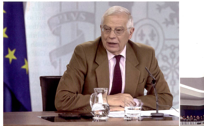
Der Spanier Josep Borrell ist der Hohe Vertreter für die GASP.