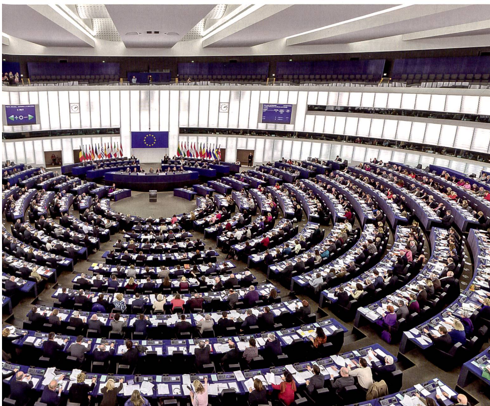
Das Europäische Parlament in Strassburg.

Die EU und ihre GASP spielen nur dann eine grössere Rolle, wenn es um entwicklungspolitische Hilfen bzw., wie jüngst im Libanon, um finanzielle Unterstützung im Falle von Katastrophen geht. Wie kann also die EU mehr aussen- und sicherheitspolitisches Gewicht in der Welt erlangen? Folgende These wurde in den letzten Jahren häufig bestätigt: «Solange