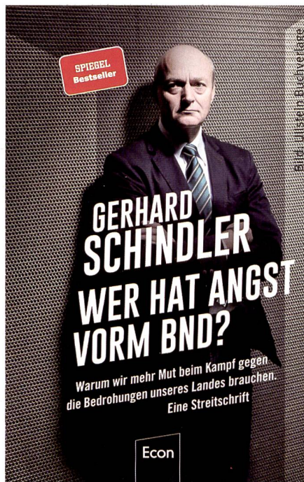
Wer hat Angst vorm BND?

Die Stärke des Buches ist, dass es von der Politik unliebsame Fragen in brutaler Offenheit darlegt und dabei nicht scheut, die Problematik bis auf ihren Grund zu