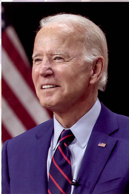
Präsident Joe Biden.