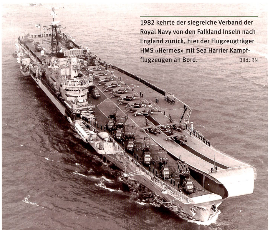
1982 kehrte der siegreiche Verband der Royal Navy von den Falkland Inseln nach England zurück, hier der Flugzeugträger HMS «Hermes» mit Sea Harrier Kampfflugzeugen an Bord.

Dank einem Abkommen von 1902 hatte England bis etwa 1920 mit Japan ein einigermaßen gutes Einvernehmen. Dieses verschlechterte sich rapide, als Japan gewaltsam sein Reich auszudehnen begann. Erst im Mai 1941 entsandte England einige Kriegsschiffe nach seinem ab 1920 gebauten Stützpunkt in Singapur, darunter die beiden Schlachtschiffe HMS «Prince of Wales» und HMS «Repulse». Nachdem Japan zeitgleich zu seinem Überfall auf Pearl Harbor eine Front in Malaysia eröffnete und Singapur bedrohte, liefen die beiden Einheiten am 8. Dezember mit dem Ziel aus, die amphibischen Landungen Japans zu verhindern. Beide Schiffe wurden innert einer knappen Stunde durch 90 japanische, landge-