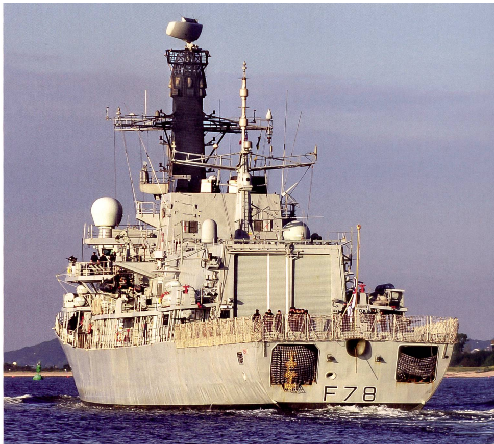
Zu den Arbeitspferden der Royal Navy gehören die 13 Fregatten der Type 23 Klasse, hier die HMS «Kent», die 2021 dem Trägerverband in den Fernen Osten angehören wird.

Die wirtschaftlich und politisch schwierigen Nachkriegsjahre ab zirka 1960 führ-