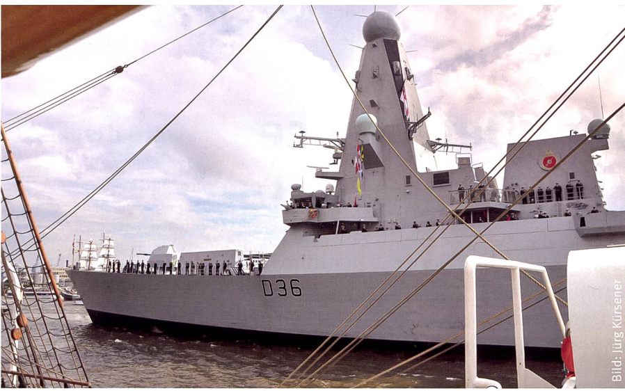
Abbildung oben: Zu den neuesten und modernsten Kampfschiffen der Royal Navy gehören Raketenzerstörer mit der HMS «Defender» als Leitschiff der Klasse.