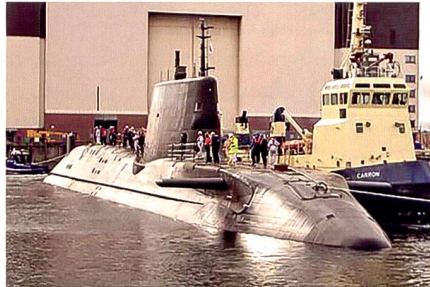
Abbildung rechts: Die HMS «Astute» ist das Leitschiff der sieben neuen nuklearen Jagd-Uboote der Royal Navy.

vorne dislozierte Verbände und/oder unterstreicht durch periodische Präsenz diese Interessen;