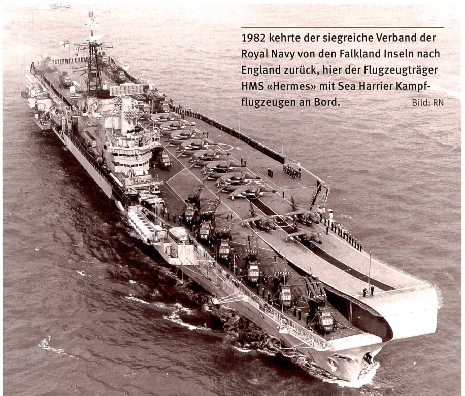
1982 kehrte der siegreiche Verband der Royal Navy von den Falkland Inseln nach England zurück, hier der Flugzeugträger HMS «Hermes» mit Sea Harrier Kampflugzeugen an Bord.

Dank einem Abkommen von 1902 hatte England bis etwa 1920 mit Japan ein einigermaßen gutes Einvernehmen. Dieses verschlechterte sich rapide, als Japan gewaltsam sein Reich auszudehnen begann. Erst im Mai 1941 entsandte England einige Kriegsschiffe nach seinem ab 1920 gebauten Stützpunkt in Singapur, darunter die beiden Schlachtschiffe HMS «Prince of Wales» und HMS «Repulse». Nachdem Japan zeitgleich zu seinem Überfall auf Pearl Harbor eine Front in Malaysia eröffnete und Singapur bedrohte, liefen die beiden Einheiten am 8. Dezember mit dem Ziel aus, die amphibischen Landungen Japans zu verhindern. Beide Schiffe wurden innert einer knappen Stunde durch 90 japanische, landge-