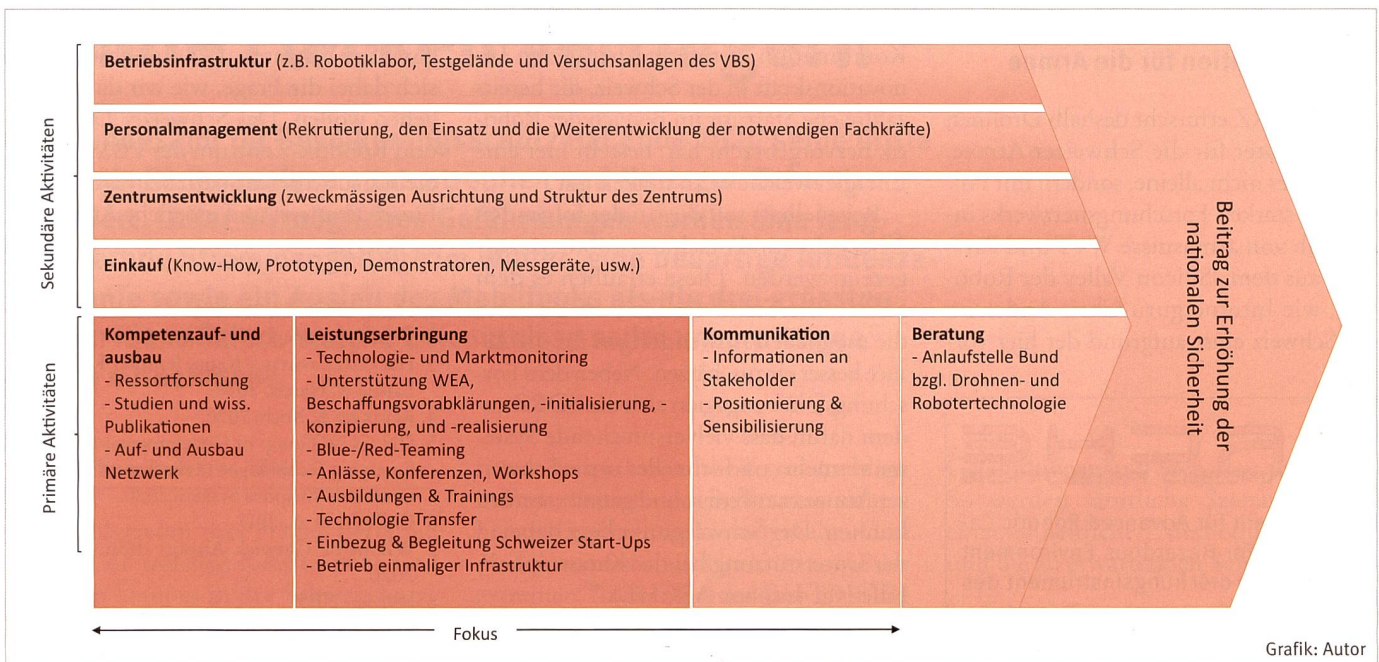
Schematische Darstellung der Wertschöpfungskette des SDRZ im Jahr 2023.

ropäischen Verteidigungsprogramms, des Future Combat Air System (kurz FCAS) eine programmbegleitende Arbeitsgemeinschaft ins Leben gerufen, die sich innerhalb des Programms der verantwortlichen Nutzung neuer Technologien und der Operationalisierung ethischer und rechtlicher Prinzipien 4 widmet. Ein anderes Beispiel ist eine Gruppe von Regierungsexperten innerhalb der Vereinten Nationen, die sich der Problematik von tödlichen autonomen Waffensystemen widmet und dazu elf wegleitende Prinzipien verfasst hat. 5