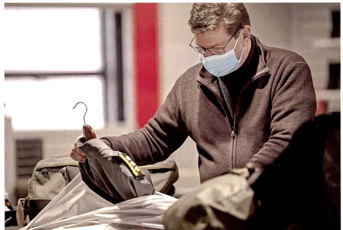
KKdt Schellenberg bei der Abgabe.

gerabwehr-Stabsbatterie. Immer noch als Milizoffizier führte Brigadier Schellenberg ab 2020 die Gebirgsinfanteriebrigade 12 im Nebenamt. Im folgenden Jahr wechselte er als Divisionär in das Kader der Berufsoffiziere, um an die Spitze des Armeestabs zu treten. Von 2013 bis 2017 befehligte der nunmehrige Schellenberg die Luftwaffe. In diesem Zeitraum suchte eine ganze Reihe von schweren Zwischenfällen die Luftwaffe heim. Wenn sie Menschenleben kosteten, zeichnete sich Schellenberg durch Anteilnahme und Mitgefühl aus, und er vermochte das auch betroffenen Angehörigen und Kameraden einfühlsam zu bekunden. ET