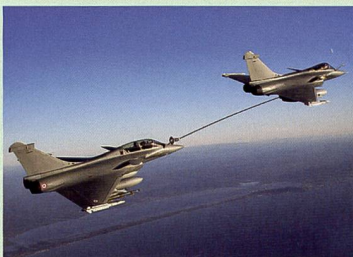
32 Luftbetankung zwischen zwei Rafale