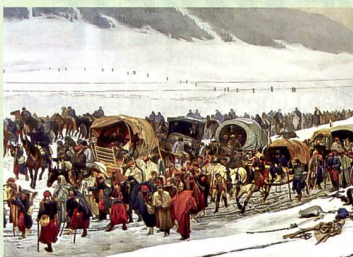
48 Internierung der Bourbaki-Armee