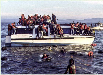
18 Syrische und irakische Flüchtlinge vor Griechenland