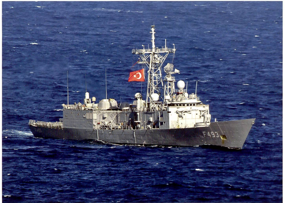
Eine türkische Fregatte als Symbol für die offensive türkische Militärpolitik im Mittelmeer, in Libyen und in Syrien.

liban präsent und treiben Steuern ein. 11 Nach Angaben von Thomas Ruttig vom Think-Tank Afghanistan Analysts Network kontrollieren die Taliban aktuell zwischen 50 und 70 Prozent des Territoriums.