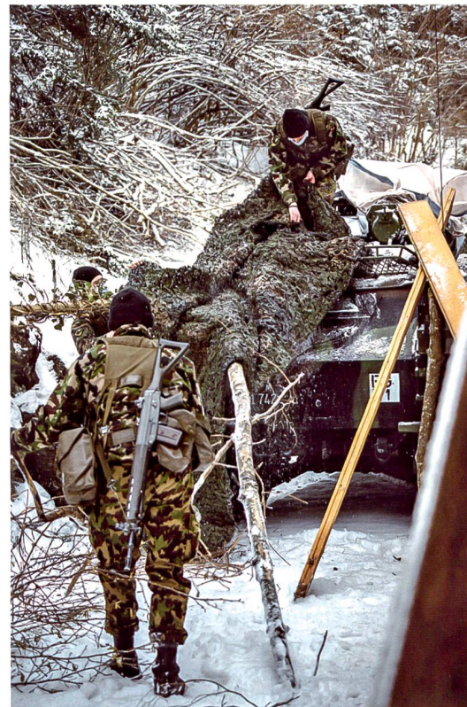
Tarnung eines «Eagle».

standhaltens. Eine bekannte Herausforderung stellte auch dieses Jahr die extrem tiefen Personalbestände dar. So mussten die Aufklärungs-Logistik- und Stabs-Kompanie zusammengelegt werden und wie bereits in den Vorjahren wurde eine Aufklä-