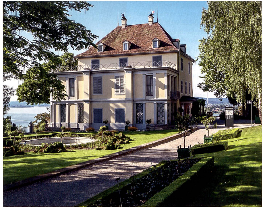
Schloss Arenenberg heute.

St. Paul, Carnot, de Bousmard que je lis présentement.» Er bat Dufour, ihm dessen Lehrgang «Mémorial pour les travaux de guerre» und den Lehrplan zuzustellen, um sich optimal vorzubereiten. Erst Anfang Juli 1830 traf die positive Antwort auf Arenenberg ein, was deutlich macht, dass man sich den Entscheid in Thun wohl überlegt hat.