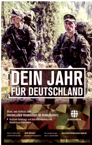
Werbung für den FDW.

ter, «die im Verbund den Kern der territorialen Reserve darstellen und die regionalen Sicherungs- und Unterstützungskompanien führen», so der Generalinspekteur der Bundeswehr, General Eberhard Zorn. Ihm geht es dabei weniger um Seuchenbekämpfung als vielmehr um den Schutz verteidigungswichtiger Infrastruktur, wie er mit Blick auf hybride Kriegsszenarien in seinem Tagesbefehl zum Start des ersten FWD-Lehrgangs anfangs April feststellte.