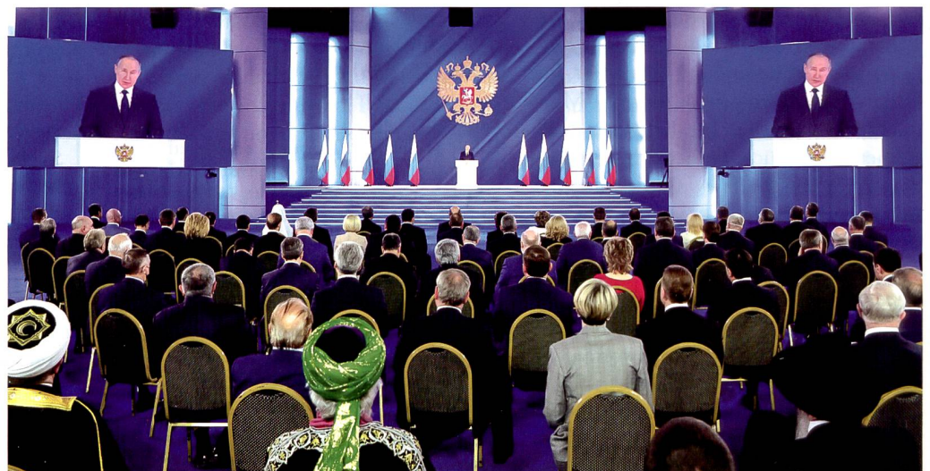
Putins Lage der Nation.

Nation, vor der Föderalen Versammlung nach: «Unser Awangard Hyperschall-Stratosphärenleiter und unser Peresvet Laserluftabwehrsystem stehen