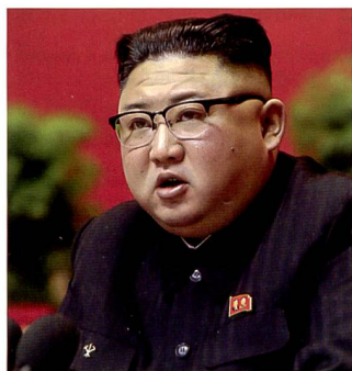
Nordkoreas Machthaber Kim Jong-un.

ge, dass er «die feindliche Politik gegenüber der Demokratischen Republik Nordkorea weiter durchsetzen will, wie sie von den USA mehr als ein