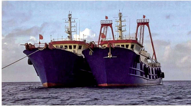
Chinesische «Fischerboote».

Für die USA ist dieser Moment eine willkommene Gelegenheit, die stark belasteten Beziehungen zu Präsident Rodrigo Duterte zu verbessern, der nach seinem Amtsantritt einen verwirrenden Schlingerkurs in den aussenpolitischen Beziehungen einschlug. Dass