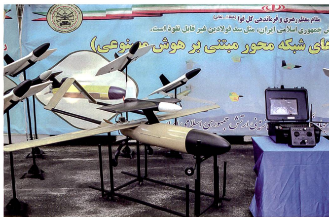
Iranisches Mass Flight System.

Ferngesteuerte und autonome Systeme sind billiger, leistungsfähiger und bringen Fähigkeiten mit sich, die ein althergebrachtes strategisches Gleichgewicht schnell einmal durcheinanderbringen können. Wurden Drohnen klassisch bislang zur Aufklärung oder – falls bewaffnet – zum Angriff auf Ziele verwendet, verlässt sich die islamische Republik seit längerem auf den Gebrauch von unbemannten Flugzeugen als eigenständige «fire and forget» Waffen. Beinahe täglich geben beispielsweise die vom Iran unterstützten Huthi Rebellen im Jemen bekannt, Drohnenangriffe auf saudi-arabische Ziele zu fliegen. Aufgrund dieser Tatsachen musste US-General Kenneth F. McKenzie Jr., Commander des Central Commands, unterdessen zugeben, dass die Schlagkraft seiner Truppen, aber vor allem die