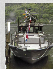
Neues Patrouillenboot