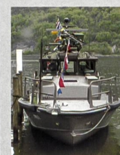
Neues Patrouillenboot