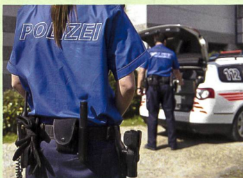
32 Die Polizeikorps stehen unter hoher Belastung