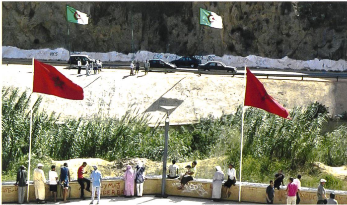
Blick über die geschlossene Grenze.

Bestandteil seines Königreichs, während von Algerien aus die nach Unabhängigkeit strebende Polisario-Bewegung unterstützt wird. Algerien prüfte deshalb zuletzt, wie es seine Sicherheitsvorkehrungen entlang der gemeinsamen Grenze, die notabene seit 1994 geschlossen ist, verstärken kann.