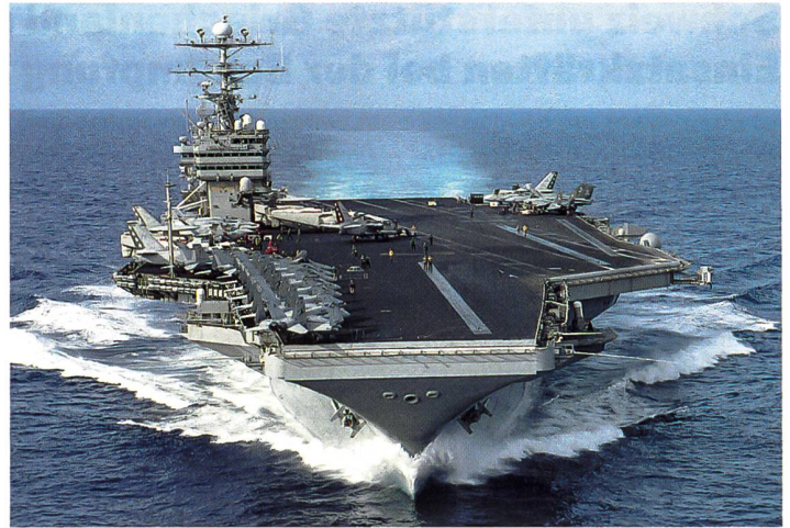
Die USS George Washington patrouilliert im südchinesischen Meer.

Biden hat China als die grösste geopolitische Herausforderung seines Landes bezeichnet. Er hat Sanktionen gegen China wegen des Umgangs mit der Minderheit der Uiguren und Demokratieaktivisten in Hong-