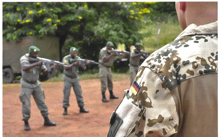
Die Bundeswehr bildet die Forces Armées Maliennes aus.

gen können oder wollen. Letztendlich ist man sich aber im Klaren, dass es bis zum Erreichen eines stabilen Friedensmechanismus noch ein langer Weg ist und die Lehren aus dem Afghanistan-Debakel weltweit zu spüren sein werden.