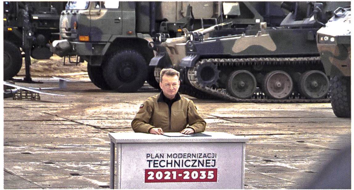
Als Verteidigungsminister Blaszczak 2019 die Modernisierungspläne verkündete.

figuration 3+ aufgestellt. Narew hingegen soll, wenn immer möglich, im eigenen Land produziert werden. Die einheimische Rüstungsindustrie darf also auf lukrative Aufträge hoffen. Allen voran der staatliche Verteidigungskonzern PGZ, der im vorliegenden Fall die benötigte Raketentechnologie einkaufen wird und in das neu zu entwickelnde Narew-System integriert. Werfer, Radargeräte und weitere Schlüsselkomponenten sind bereits in der Planung. Es geht um ca. 23 Batterien. Experten stellen fest, dass Polen für eine solide Luftverteidigung zwar auf «ausländische» Abfangjäger angewiesen ist, sämtliche bodengestützte Systeme aber unterdessen alleine bereitstellen kann. Die lokale Rüstungsindustrie hat dazu in den letzten Jahren beträchtliche Mittel aufgebracht und will Narew bis 2026 liefern. Weitere zu beschaffende Rüstungsgüter: 32 Kruk-Kampfhelikopter und drei Unterseeboote, welche die