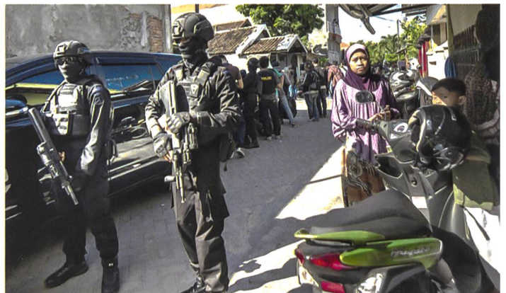
Indonesische Spezialkräfte im Einsatz gegen Islamismus.

Verdächtige gefasst. Aber die grosse Zahl deutet eben auch darauf hin, wie breit das Feld von Sympathisanten ist. Und Anti-Terror-Chef Boy Rafli Amar befürchtet, dass die Euphorie über den Talibansieg zu neuen Rekrutierungen ermuntern könnte. Nach Einschätzung des Experten Satria werden die Ereignisse in Afghanistan vor allem eine langfristige Wirkung entfalten.