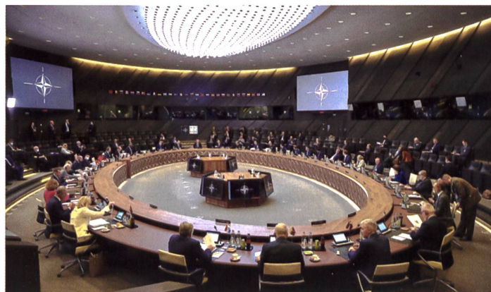
NATO-Verteidigungsminister beschliessen KI-Strategie.

zielen werden. Andererseits besteht aber noch keine klare Vision darüber, wie sich KI auf den NATO-Mission-Support und ihre Operationen insgesamt auswirken sollen. Stratcom-Effektanalyse mittels Big Data bis hin zu autonomer Ersatzteilbeschaffung durch 3D-Druck auf dem Schlachtfeld – alles scheint denkbar. Um das Potenzial von KI dereinst optimal nutzen zu können, ist dieses Strategiepapier deshalb unerlässlich. Der technologische Vorsprung wird entscheidend sein. Hier möchte sich die Allianz offenbar selbst revolutionieren. Denn während bisher (und das soll auch in Zukunft so bleiben) das Gesamtsystem NATO über (nur schwerfällig umzusetzende) Interoperabilität und das Setzen von Standards funktionierte, soll KI nun ein eigenes Innovationsökosystem mit kurzlebigen,