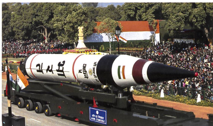
Rakete des Typs «Agni 5».

stürzte in den Golf von Bengalen. Das teilte das indische Verteidigungsministerium mit. Bei der Rakete handelte es sich um den Typ «Agni-5». Sie hat eine Reichweite von bis zu 5000 Kilometern und kann mit Atomsprenköpfen bestückt werden. Indien hatte die 17 Meter langen «Agni-5»-Raketen bereits