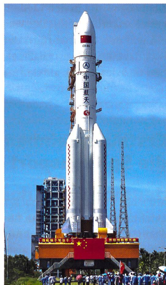
Rakete des Typs «Langer Marsch 5».

Die britische Zeitung «Financial Times» hatte zuvor unter Berufung auf fünf anonyme Quellen hingegen berichtet, dass China im August einen Hochgeschwindigkeitsgleitkörper mit einer Rakete des Typs «Langer Marsch» ins All geschickt habe. Im Weltraum sei das Geschoss bei niedriger Umlaufbahn ein-