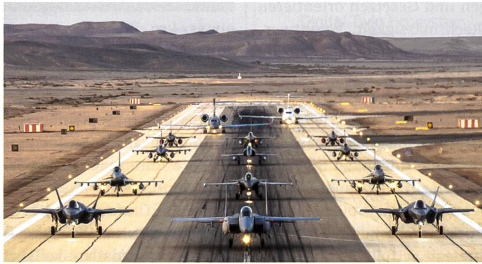
Defilee in Ovda.

Alle zwei Jahre findet in Israel die Luftwaffenübung «Blue Flag» statt. Im Oktober dieses Jahres sogar als die grösste Ausgabe seit ihrem Bestehen. Mehr als 1500 Soldaten fanden sich dazu in der Negev auf der Airbase Ovda ein. Darunter auch internationale Teilnehmer aus Deutschland (sechs Eurofighter), Italien (fünf F-35), das vereinigte Königreich (sechs Eurofighter), Frankreich (vier Rafale), Indien (fünf Mirage), Griechenland (vier F-16) und den USA (sechs F-16). Die Israelis trugen mit F-35, F-16 und F-15 dazu bei, dass die «Erweiterung und Verbesserung der operativen Fähigkeiten der teilnehmenden Streitkräfte» gefördert wird, wie das Ziel der Übung lautete. Schwerpunkte lagen dabei auf Luft-Luft- und Luft-Boden-Angriffen sowie dem Ausweichen