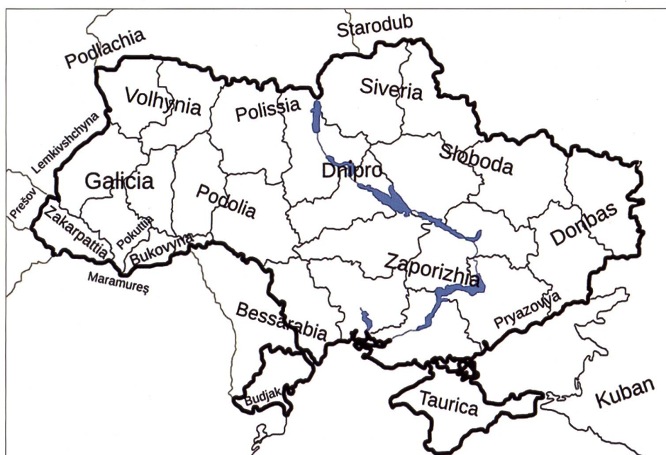
◀ Die Regionen der Ukraine (historisch). Karten: Wikipedia

Die Armeen der Kriegsparteien entstanden als leichtbewaffnete Milizen. Als die Bolschewisten 1918/19 auf Kiew zu marschierten, hatten sie wie ihre Gegner von der Ukrainischen Volksrepublik kaum mehr als 6000 Mann unter Waffen. Im Laufe der kommenden Monate und Jahren änderte sich das. Die Zahl der Soldaten stieg beträchtlich an, und