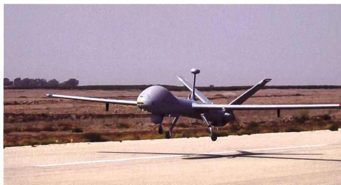
◀ Die Aufklärungsdrohne Hermes 900 HFE im Landeanflug auf eine Piste.

Ziel der Ausbildung ist es, die Aw Of LA zu befähigen, Einsätze von Intelligence, Surveillance und Reconnaissance (ISR) mit der Plattform ADS 15 zu planen und in Zusammenarbeit mit der Drohnen-Crew die Bilder zu beschaffen. Die Einsätze müssen unter Berücksichtigung des Leistungsvermögens