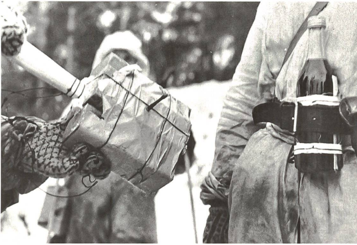
◀ Mit improvisierten Panzerabwehrwaffen (Geballte Ladung und Molotow-Cocktail) wehrten sich die Finnen effektiv gegen sowjetische Panzer und gepanzerte Fahrzeuge.