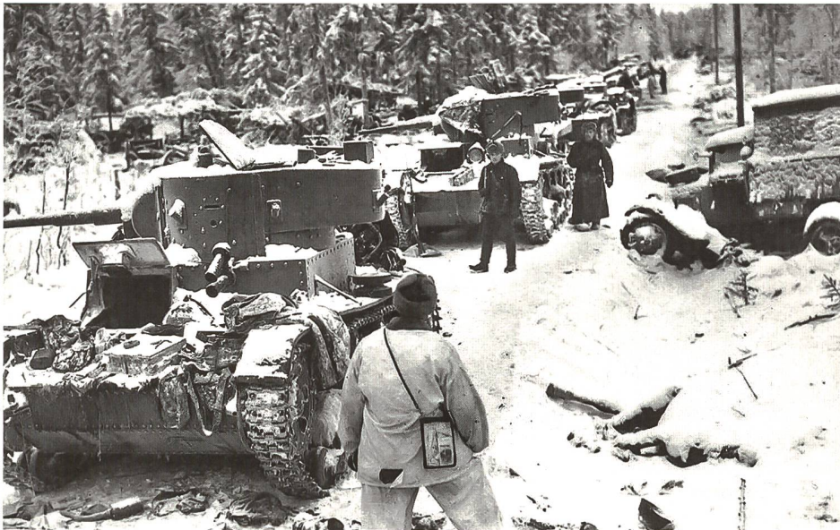
▼ Finnische Soldaten inspizieren eine zerstörte sowjetische Panzerkolonne.

neten sich insbesondere durch ihren «sisu» aus, ein kultureller Begriff, der schwierig zu übersetzen ist und sowohl Unnachgiebigkeit, Kampfesmut, Improvisationstalent als auch Resilienz in sich vereint und in besonders ausgewogenen Situationen Anwendung findet.