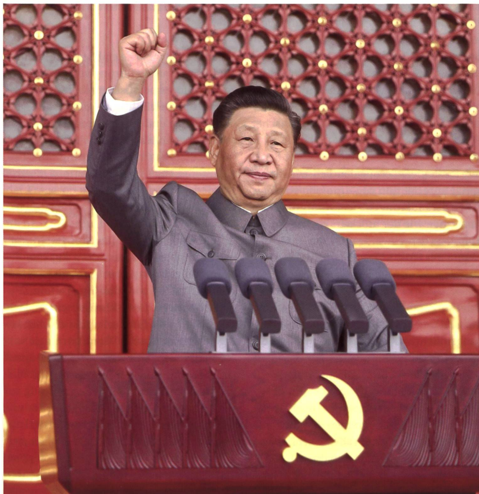
◀ 100 Jahre Kommunistische Partei – Xi Jinping beschwört die nationale Wiedergeburt Chinas.

Die aus einer Dissertation hervorgegangene schlüssige Studie gründet sich auf einen teilweise bislang unerforschten, reichen Quellenbestand autoritativer Dokumente der KPCH und massgeblicher Parteifunktionäre. Es ist diese tiefeschürfende Grundlagenarbeit, die ein wesentlich ergänzendes Verständnis von Chinas Sicht von sich selbst und seinem strategischen Ehrgeiz in der Welt ermöglicht. Sie offenbart, dass sich dessen Machtelite vor allem seit Amtsübernahme Xi Jinpings (2012: Generalsekretär