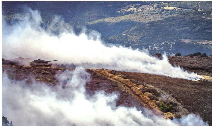
Griechischer Leopard im Trainingseinsatz.

Athen benötigt schweres Gerät. Deshalb sollen 183 Kampfpanzer Leopard 2 A4 auf den Standard A7 modernisiert werden, mit der Option auf den Ausbau mit Trophy, einem abstandsaktiven Schutzsystem. Dazu kommen 190 Leopard 1 A5 mit neuer Zieloptik. Die Panzer alleine kosten etwa 1,3 Milliarden Euro. Die Trophy-Zielzuweisung macht weitere 600 Millionen Euro aus. Den Upgrade würde das deutsche Rüstungsunternehmen KMW übernehmen, das auch die vom israelischen Hersteller Rafael stammenden Trophy-Einbauten übernimmt.