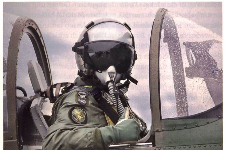
Österreichischer Pilot, Daumen hoch?

den enorme Budgeterhöhungen be- und versprochen. Von aktuell 2,7 Milliarden Euro (0,62% des BIP) rauf auf 6 Milliarden (1,5% des BIP) im Jahr 2025 soll es gehen. Die Neutralitätsfrage wird dabei laut dem Bundespräsidenten Van der Bellen explizit nicht gestellt werden. Inwiefern die bewaffnete Neutralität in Zukunft, auch mit massiv mehr Geld aufrecht-