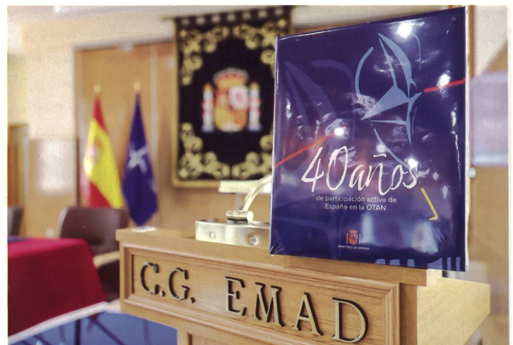
Präsentation der Festschrift zum Jubiläum.

Wollte Spanien zuerst lediglich im Rahmen der EU-Bemühungen der Ukraine mit humanitären Gütern und militärischem Material helfen, so wurde unterdessen bekannt, dass das Königreich auch Luftabwehrraketen sowie gebrauchte Kampfpanzer Leopard 2, die es aus alten Bundeswehrbeständen in Deutschland kaufte, in die Ukraine schicken will. Gerade die Hilfeleistung mittels modernen Panzern wäre gesamteuropäisch ein «Game-Changer». Gleichzeitig hat das Land zum zweiten Mal infolge seiner Teilnahme an der internationalen Militärübung «African Lion» (unter