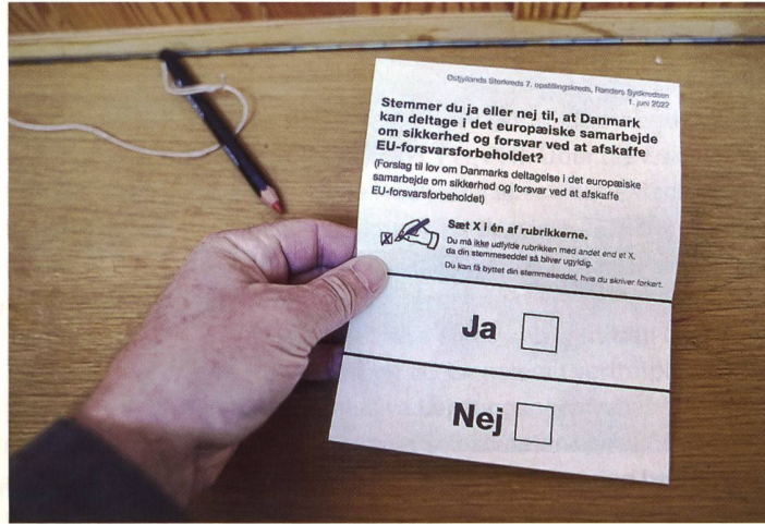
Zweidrittel Ja-Stimmen zur GSVP.

Ursula von der Leyen, EU-Kommissionspräsidentin, liess ihrer Freude freien Lauf. Unter Verwendung des Hashtags #strongertogther gratulierte sie den Dänen via Twitter zum Ausgang des Referendums über den Beitritt zur Gemeinsamen Sicherheits- und Verteidigungspolitik (GSVP) der Europäischen Union. Von etwa 4,3 Millionen dänischen Abstimmenden sprachen sich 66,9 Prozent dafür aus, dass ihr Land fortan auch mit Truppenentsendungen innerhalb der europäischen Verteidigungsarchitektur aktiv werden kann. Im Königreich geht man davon aus, den formellen Beitritt am 1. Juli