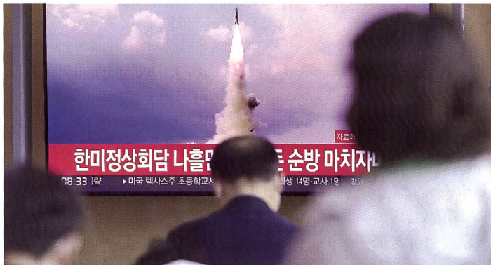
Interkontinental-Rakete Nordkoreas im südkoreanischen Fernsehen.

anzuheizen. US-Präsident Joe Biden bekräftigte aber auch, dass er an der Politik der «strategischen Zweideutigkeit» in der Taiwan-Frage festhalte. Dieser seit Langem verfolgte Kurs bedeutet, dass die Vereinigten Staaten zwar Taiwan Unterstützung beim Aufbau von dessen Verteidigungsfähigkeiten zusichern, aber nicht ausdrücklich versprechen, der Insel im Falle eines Krieges zu Hilfe zu kommen. Sc