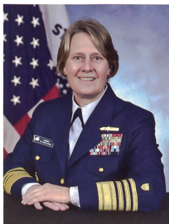
Admiral Linda Fagan.

Schultz ab, der vier Jahre das Kommando innehatte. In den USA gehört die 1915 gegründete Küstenwache offiziell zum Militär. Insgesamt gibt es in den Vereinigten Staaten sechs Teilstreitkräfte: Neben der Küstenwache gehören dazu das Heer, die Luftwaffe, die Marine, das Marineinfanteriekorps und die