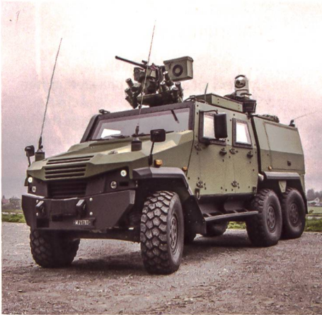
Eagle V 6x6 als Ersatz für M113 Führungsfahrzeuge.

nungssicherheit. Und wenn keine Planungssicherheit besteht, verzichtet man gegenüber der Öffentlichkeit auf die Kommunikation künftiger Beschaffungsvorhaben: Es sei ohnehin meist alles überholt, was man veröffentlichen. Somit bewegten wir uns zuletzt kommunikativ in einem Teufelskreis, um nicht von einem Schwanzbeisser zu sprechen.