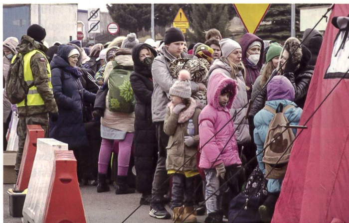
Polnischer Soldat und ukrainische Flüchtlinge.

Die Unterstützung an die Ukraine mittels militärischer Güter durch Polen belief sich Anfang Juli auf etwa 1,8 Milliarden Euro. Davon ausgenommen ist folgender Waffendeal: «Wir unterzeichneten einen der grössten – wenn nicht sogar den grössten – Rüstungsexportvertrag der letzten drei Jahrzehnte», so Premierminister Mateusz Morawiecki bei einem Besuch im Stahlwerk Stalowa Wola im Juni. Dort stellen sie die polnischen Panzer-Haubitzen des NATO-kompatiblen Typs Krab her, die nun für etwa 650 Millionen Euro in die Ukraine geliefert werden. Insgesamt erfüllt Polen sein Rüstungsziel von den geforderten zwei Pro-