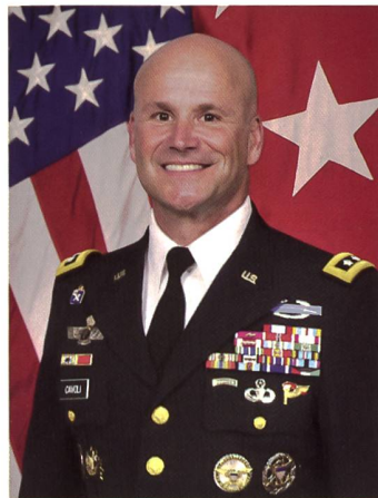
General Christopher G. Cavoli.

oberpfälzischen Grafenwöhr, wo er von 2014 bis 2016 den Truppenübungsplatz des US-Heeres leitete. Als Soldat war er in Italien, bevor er an der Universität Yale einen Abschluss in Osteuropa-Studien machte. Zwischen 2001 und 2005 arbeitete Cavoli im Führungsstab der US-Streitkräfte in Washington als «Russland-Direktor». Zuletzt war er