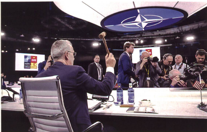
Generalsekretär Stoltenberg eröffnet den NATO-Gipfel in Madrid.

dere die Vorgehensweise gegenüber der russischen Gefahr umschreibt. Russland wurde erstmals als bedeutende und direkte Bedrohung für die NATO und deren Mitglieder bezeichnet. Aber auch weiteren Bedrohungen wie Terrorismus, Cyber und das hybride Spektrum sowie zum ersten Mal auch die in Zusammenhang mit China bevorstehenden Herausforderungen werden thematisiert. Ebenfalls wurde das Netto-Null-Ziel hinsichtlich der von der NATO verursachten Treibhausgasemissionen beschlossen, bis 2050 soll die Allianz klimaneutral werden. Es wird einen Innovationsfonds geben, der primär dazu dient den technologischen Vorsprung des Bündnisses zu sichern. Ebenfalls wurden die Probleme im Nahen Osten, Nordafrika und des Sahels thematisiert. Zum ersten Mal in der Geschichte der NATO waren auch Australien, Japan, Neuseeland und die Republik Korea an einem Gipfel anwesend. pk