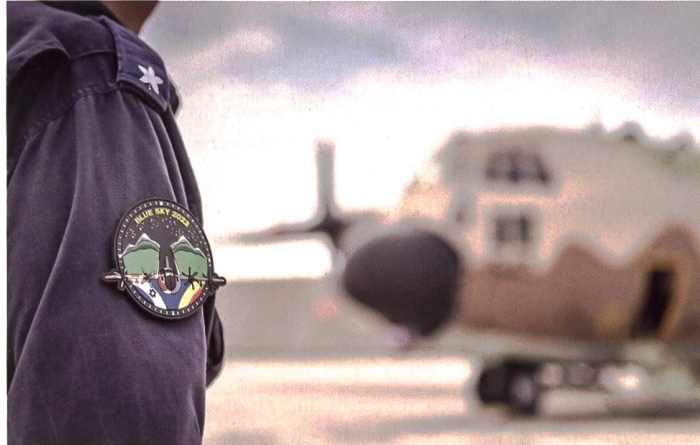
Israelische Luftlandeübung in Rumänien.

ständige Brigadegeneral und Kommandant der Nevatim Airbase, Gilad Keinan, gab aber zu verstehen, dass «das Training am rumänischen Himmel eine einmalige Gelegenheit für seine Formationen ist, um sich herauszufordern, zu verbessern und damit stärker zu werden.