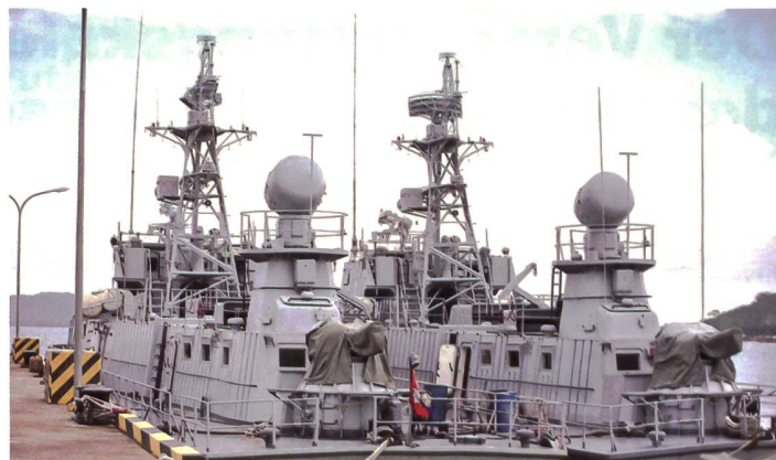
Kambodschanische Schiffe am Marinestützpunkt Ream.

Geldern finanziert und sollen in zwei Jahren beendet werden. Die Washington Post hatte enthüllt, dass ein Teil der Anlage ausschliesslich vom chinesischen Militär genutzt werden solle. China, so die von der Post zitierten Diplomaten, wolle ein Netz von Militäreinrichtungen auf der ganzen Welt aufbauen, um eine echte Weltmacht zu werden. Der Ausbau der Basis sei 2020 beschlossen worden; um die Anwesenheit von Chinesen auf dem Stützpunkt zu verschleiern, seien mehrere Massnahmen ergriffen worden. So werde ausländischen Delegationen, die den Stützpunkt besuchten, nur der Zugang zu vorher genehmigten Orten gestat-