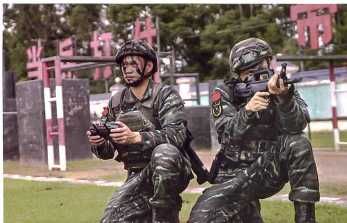
Chinas Spezialeinheiten üben den Kampf verbundener Waffen mit Drohnen.

setzen, verhalte sich dabei aber zurückhaltender als etwa Russland, sagt Leoni. «Letztendlich aber muss China seine Handelsrouten absichern.» Das Militärspiele dabei eine wichtige Rolle; es gehe auch darum, respektiert zu werden. Die Volksrepublik hat nur einen einzigen Militärstützpunkt in Übersee, nämlich im ostafrikanischen Dschibuti. In der eigenen Region, im asiatisch-pazifischen Raum, ist China allerdings sehr ambitioniert und will dort auch militärisch die Nummer eins werden. Ein dritter chinesischer Flugzeugträger soll demnächst vom Stapel laufen und Chinas Stärke demonstrieren. Selbstbewusste und teils riskante Machtprojektionen mit Kriegsschiffen und Kampffjets im Süd- und Ostchinesischen Meer gehören längst zum Alltag und verstören die Nachbarstaaten, die sich zunehmend von Peking bedroht fühlen. Noch habe China nicht die militärische Stärke, die traditionelle Ordnungsmacht, die USA, aus der Region zu verdrängen, sagen Experten. sc