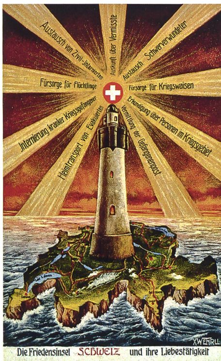
Die Schweiz als Friedensinsel und ihre Guten Dienste: Postkarte von 1917.

Dank der ungeplant geglückten Mischung von Widerstand, Anpassung und internationalen Dienstleistungen, vor allem aber dank dem Sieg der Alliierten, blieb die Schweiz vom Krieg verschont.