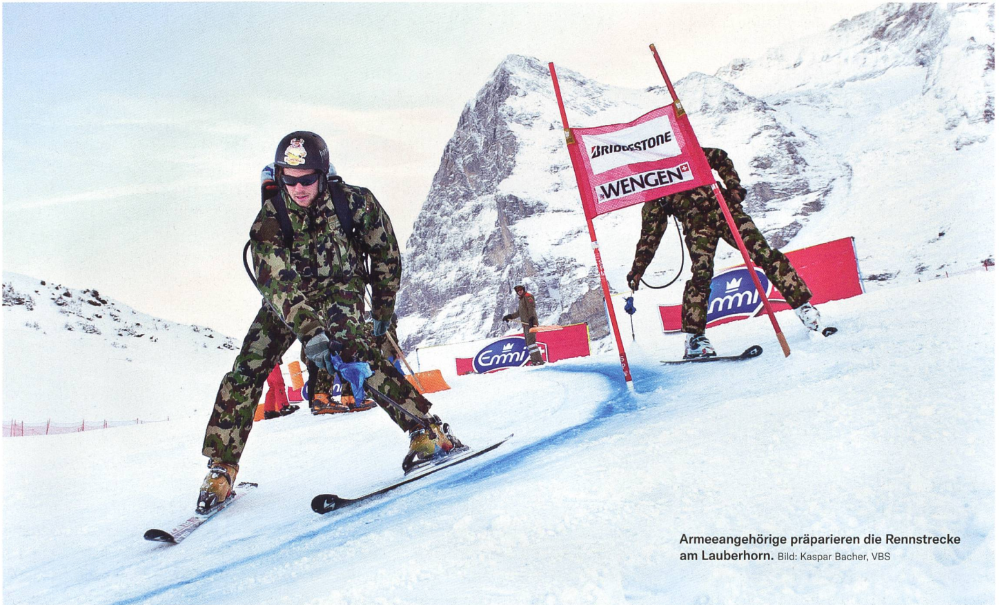
Armeeinghörige präparieren die Rennstrecke am Lauberhorn.

vorsehen» subsumieren, wenn der herrschenden Lehre gefolgt wird. 17 Die Verfasser stellen sich weiter auf den Standpunkt, dass sich die Ausweitung der Unterstützung mit militärischen Mitteln bei grossen Sportanlässen sowie kulturellen Veranstaltungen nicht mit Art. 58 Abs. 2 BV vereinbaren lässt, weshalb es folgerichtig einer Verfassungsänderung bedürft hätte. Über die Gründe, weshalb diese nicht angedacht wurde, kann nur gemutmasst werden.