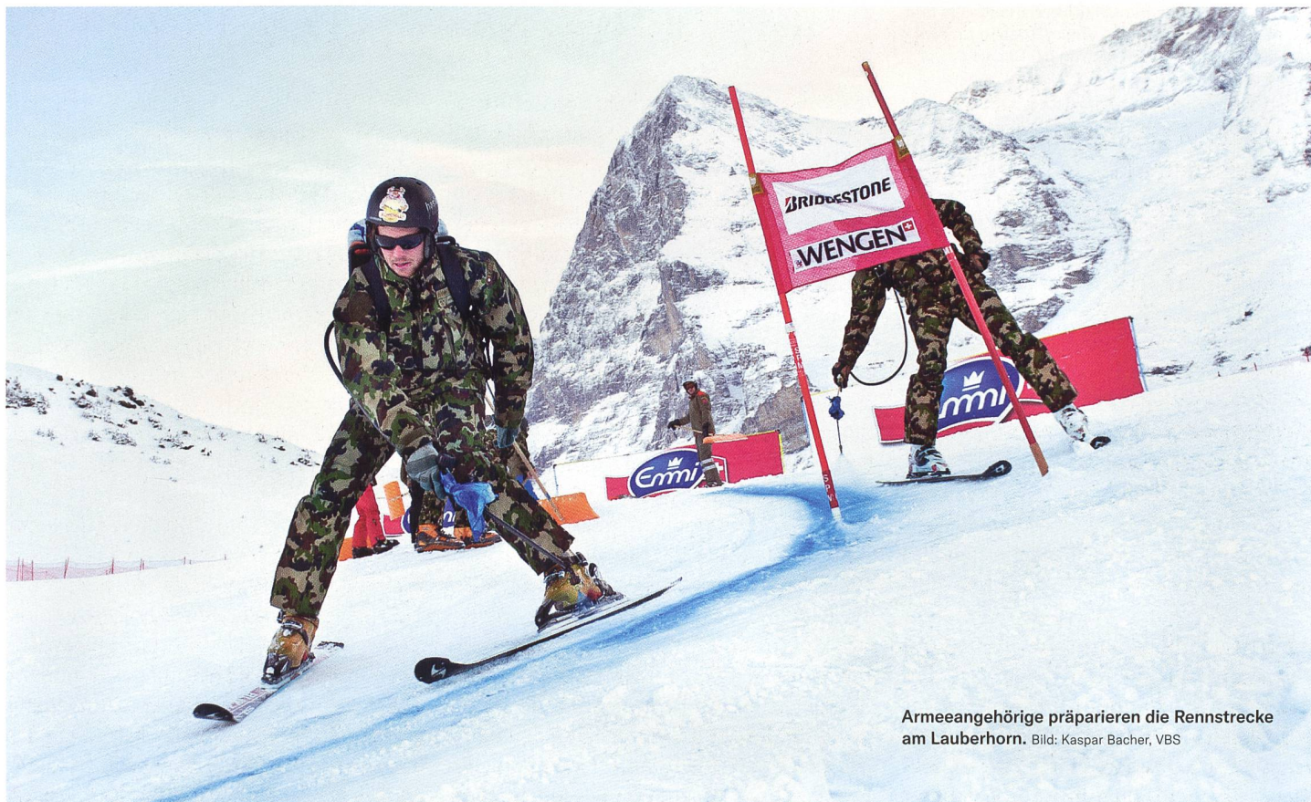
Armeeangehörige präparieren die Rennstrecke am Lauberhorn.

vorsehen» subsumieren, wenn der herrschenden Lehre gefolgt wird. 17 Die Verfasser stellen sich weiter auf den Standpunkt, dass sich die Ausweitung der Unterstützung mit militärischen Mitteln bei grossen Sportanlässen sowie kulturellen Veranstaltungen nicht mit Art. 58 Abs. 2 BV vereinbaren lässt, weshalb es folgerichtig einer Verfassungsänderung bedürft hätte. Über die Gründe, weshalb diese nicht angedacht wurde, kann nur gemutmasst werden.