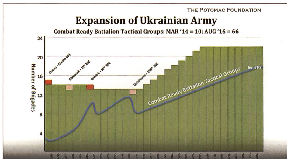
Der Aufwuchs der ukrainischen Landstreitkräfte von 2014 bis 2016.

Erst ab April verlagerte sich der Hauptkampf in die Ostukraine, wo ihn Kiew ursprünglich erwartet hatte. Neben den regulären Brigaden stemmten sich auch leichtere Territorialinfanterie, Nationalgardisten und diverse Freiwilligenformationen aus dem In- und Ausland der russischen Artilleriewalze entgegen. Die Opfer der unzureichend bewaffneten Infanterie erlaubten es zumindest, die