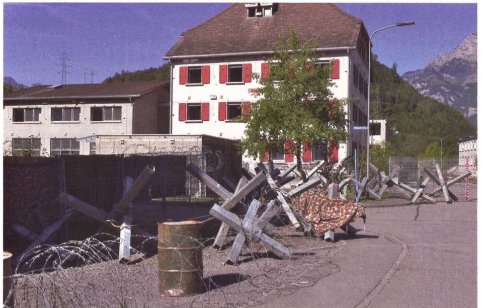
Unmengen von Härtungsmaterial machen aus dem Dorf einen Stützpunkt.

2002 in eine Infanterie-Rekrutenschule eingerückt, wurden mir jedoch in Schulen, Lehrgängen und Kursen während 20 Jahren schwergewichtig Einsätze zur Unterstützung ziviler Behörden und passend dazu das Soldatenbild des miles protector 1 vermittelt. Ob das genügt, wird spätestens seit dem 24. Februar 2022 selbst in nichtmilitärischen Kreisen wieder diskutiert. Der deutsche Historiker Sönke Neitzel zitierte schon zuvor den früheren Generalinspekteur der Bundeswehr, General aD Naumann mit der Aussage, dass «Offiziere und Unteroffizie-