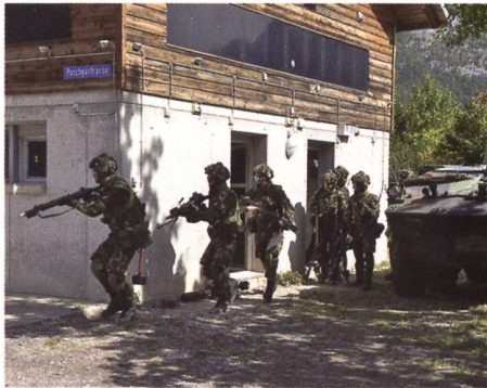
Übungen auf Gegenseitigkeit sind für die erfolgreiche Ausbildung unabdingbar.

Eine auf Unterstützung ziviler Behörden gedrehte Verhältnismässigkeit macht