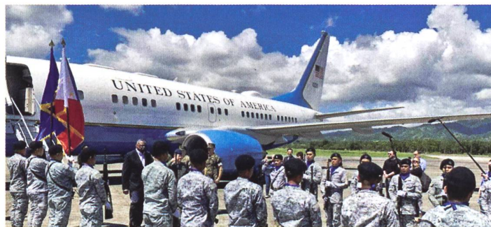
Empfang von US-Verteidigungsminister Lloyd Austin auf den Philippinen.

Die USA haben sich den Zugang zu weiteren vier Militärstützpunkten auf den Philippinen gesichert. Eine entsprechende Vereinbarung wurde bei einem Besuch von US-Verteidigungsminister Lloyd Austin in dem