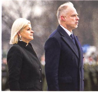
Klaudia Tanner in Ungarn.

der ungarische Verteidigungsminister so zusammenfasst: «Wir leben in einer Zeit der Gefahr.» Wie Österreich stehe Ungarn deshalb auf der Seite des Friedens. Ob dies mit ein Grund sei, dass Ungarn (nebst der Türkei) das einzige Land ist, welches den NATO-Beitritt Schwedens und Finnlands noch nicht ratifizierte, blieb ungeklärt. Ebenfalls wurde die Weigerung Ungarns, Flüchtlinge nach EU-Recht zu registrieren, nicht thematisiert. Festgehalten wurde jedoch, dass in guter österreichisch-ungarischer Freundschaft auf die Lie-