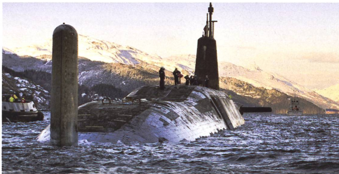
Auf der HMS Vanguard kam es zu fehlerhaft ausgeführten Reparaturen.

brochen und wurden, anstelle diese zu ersetzen, mit Leim angeklebt. Ingenieure der Werft erkannten dies zwar, der Grund für den Defekt wurde aber verheimlicht. Klar ist, dass gerade an atomaren Unterseebooten keine Abstriche an Qualitätsanforderungen gemacht werden dürfen. Glücklicherweise wurden die Schäden, welche an der Isolierung der Kühlmittelrohre des Kernreaktors entstanden, just vor einem Volleistungstest entdeckt. Der Zwischenfall führte dazu, dass sich Verteidigungsminister Ben Wallace mit dem Geschäftsführer von Babcock International traf, der verantwortlichen Firma für die Kampfwertsteigerungsprogramme für die Vanguard-Klasse-U-Boote, «um Zusicherungen für die zukünftige Arbeit zu suchen». pk