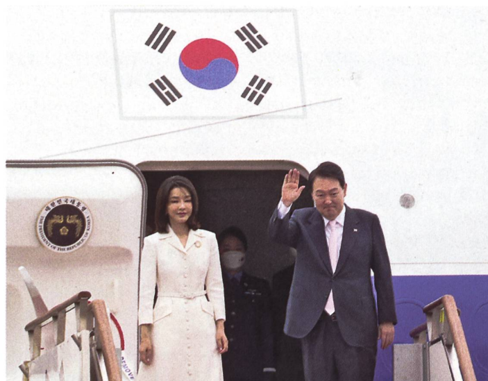
Südkoreas Präsident Yoon Suk Yeol und seine Frau Kim Keon Hee.

Der Konflikt auf der geteilten koreanischen Halbinsel hatte im vergangenen Jahr wieder deutlich an Brisanz gewonnen. Nordkorea schoss in erhöhter Frequenz atomwaffenfähige Raketen ab. Die Streitkräfte der USA und Südkoreas nahmen ihre gemeinsamen Militärübungen wieder in vollem Umfang auf. Durch die Spannungen wurde in Südkorea auch die Diskussion um eine eigene Atomwaffenwieder angeheizt. sc