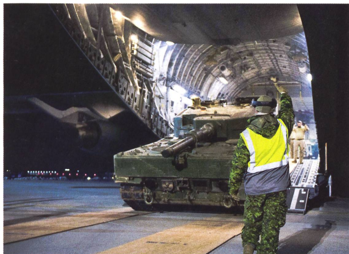
Ein kanadischer Leopard wird in Polen ausgeladen.

könnte als Antwort dienen, warum Scholz letztendlich keine andere Wahl mehr hatte, als dem Leopard ein «Panzer Marsch!» zu erteilen. Konsolidiert wurden diese Bemühungen am EU-Ukraine-Gipfel am 3. Februar. Gerade bezüglich seiner Sicherheitsverantwortung kennt Europa unterdessen seine Verantwortung und will diese auch wahrnehmen, wie in der gemeinsamen Erklärung zum Treffen festgehalten wurde. Dass kurz nach dem Spitzengespräch in Kiew dann auch Norwegen Hilfe im Wert von etwa sieben Milliarden Euro (über fünf Jahre verteilt) verspricht, zeigt, dass die Hilfestellung gegenüber der Ukraine nicht auf das politische Europa reduziert werden darf. pk