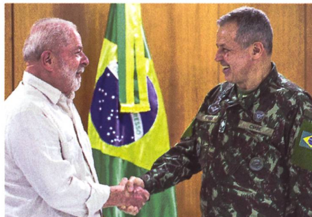
◀ Lula und der neue Kommandant der brasilianischen Streitkräfte.

mandant im Südosten des Landes. Lula hatte kürzlich gesagt, die Geheimdienste in Brasilien hätten am 8. Januar versagt, als Anhänger des ehemaligen Präsidenten Jair Bolsonaro Regierungsgebäude in Brasilia gestürmt hatten. Zuvor hatte Lula erklärt, er vermute eine geheime Absprache von «Leuten innerhalb der Streitkräfte» bei dem Aufstand; mehr als 4000 Bolsonaro-Anhänger waren in das Kongressgebäude, den Präsidentenpalast und den Obersten Gerichtshof eingedrungen und hatten dort randaliert. Mehr als 1000 Menschen wurden noch am Tag der Ausschreitungen festgenommen. sc