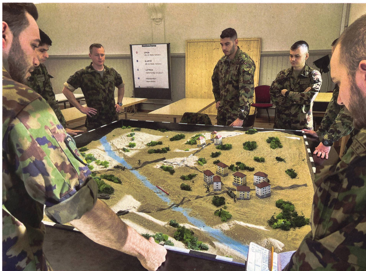
◀ Funkdrill am Sandkasten im TLG I der Pz/Art OS 22.