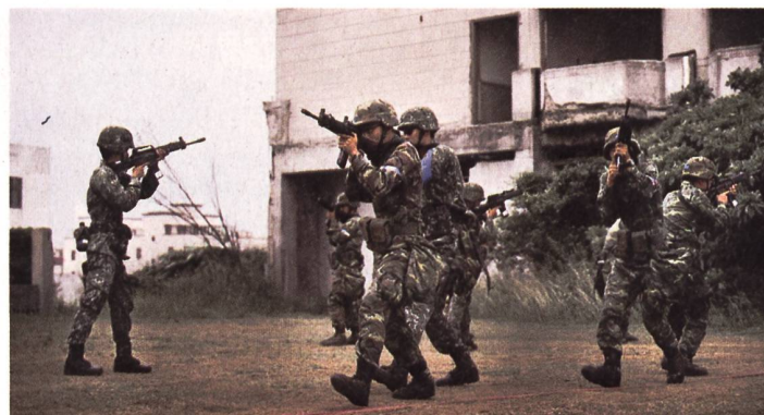
Streitkräfte Taiwans üben den Kampf in überbautem Gebiet.

Die Vereinigten Staaten verstärken die militärische und politische Unterstützung für Taiwan. Wie das Pentagon anfangs März mitteilte, genehmigte das State Department mögliche Rüstungslieferungen im Wert von 619 Millionen Dollar, darunter Raketen für F-16-Kampflugzeuge. «Der vorgeschlagene Verkauf wird die Fähigkeit des Empfängers erhöhen, seinen Luftraum zu verteidigen, ebenso wie die regionale Sicherheit und die Interoperabilität mit den Vereinigten Staaten», heisst es in der Mitteilung. Die beteiligten Rüstungskonzerne Lockheed Martin und Raytheon Technologies hatte China im Februar auf seine Sanktionsliste gesetzt. In den vergangenen Tagen war zudem bekannt ge-