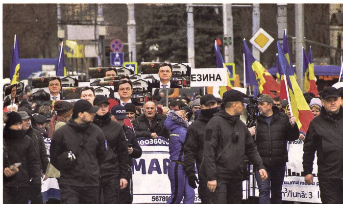
Russische TikTok-Revolution in Chisinau?

im November 2022 dürfte dieses Unterfangen jedoch vom Tisch sein. Weil der Krieg die russischen Streitkräfte zudem über das erwartete Mass strapaziert, scheinen die Ambitionen, aus Transnistrien heraus eine weitere Front gegen die Ukraine oder gar einen Krieg gegen Moldawien vom Zaun zu brechen, minimal. Für die abtrünnige Republik wird das nun zum Existenzproblem. Je weniger Unterstützung aus Moskau zu erwarten ist, desto grösser bewertet die transnistrische Regierung die Möglichkeit für eine grössere Aktion aus Moldawien respektive der Ukraine. Nur, diese Erzählung basiert auf der von Moskau gesteuerten staatlichen Propaganda. Es wird dabei behauptet, dass die moldawische Präsidentin Maia Sandu zusammen mit dem ukrainischen Präsidenten Wolodimir Selenskyj, paktiert, um auf diese Weise gemeinsam gegen die Separatisten