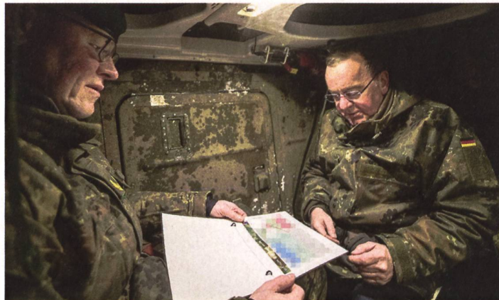
Der deutsche Verteidigungsminister Boris Pistorius lässt sich in die Übungslage einweisen.

land sind Teil der von Berlin bereitgehaltenen Kampfbrigade zur Verteidigung des Baltikums, die Bundeskanzler Olaf Scholz im Juni 2022 dem litauischen Präsidenten Nauseda versprochen hatte und seit Herbst 2022 im Land präsent ist. Während man in Vilnius aber davon ausgeht, dass die Taskforce ihren permanenten Standort in Zukunft im Rotationsprinzip in Litauen haben wird, ist man in Deutschland derzeit der Meinung, eine innert zehn Tagen im Bedarfsfall verlegbare kampfbereite Brigade vorzuhalten. Einige der Gründe dafür: In Litauen fehlt die geeignete Infrastruktur und die deutsche Bundeswehr kämpft vorerst noch mit Material- und Ausrüstungsproblemen. Laut Berichten gibt es zudem Probleme mit den modernsten Leopard 2 A7V, von welchen 30 der insgesamt 44 für die NATO-Verteidigung bereitgestellt werden müssen. Anfang Februar waren davon lediglich 20 einsatzbereit gewesen. Für Pistorius kein Grundsatzproblem, auch wenn das Hin- und Herschieben von Ausrüstung zwischen den Einsatzverbänden mittlerweile zur Usanz gehört. «Wir hatten einen Stau bei der Wartung und Instandsetzung und der wird jetzt aufgelöst», so der Verteidigungsminister. pk